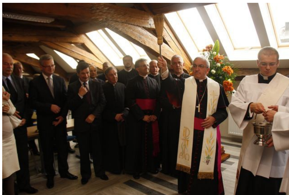
Poświęcenia Biblioteki dokonuje arcybp Celestino Migliore, Nuncjusz Apostolski w Polsce, w obecności bpa Wiktora Skworca, Ordynariusza Tarnobrzegskiego i ks. prał. Jacka Nowaka, Rektora WSD w Tarnobrzegu