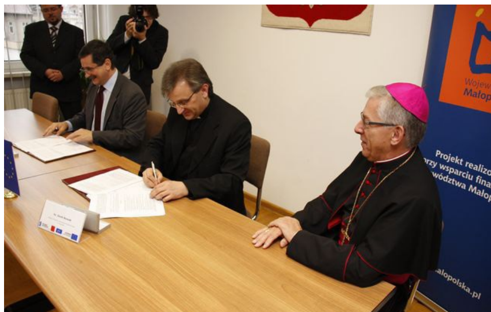
Podpisanie umowy o dofinansowanie projektu modernizacji biblioteki - 23 listopada 2009 r.