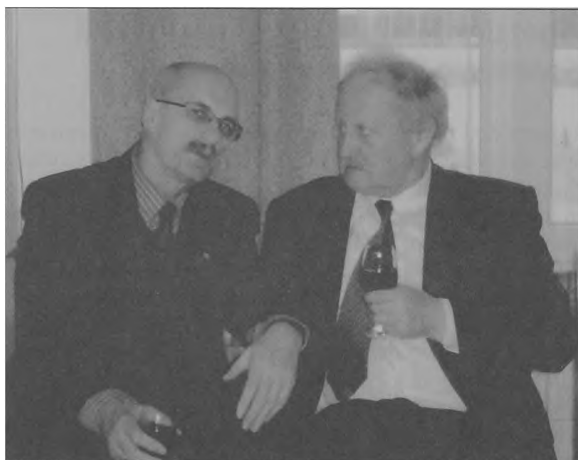
Fot. 1. W klubie uczelnianym AWF, Warszawa 2005