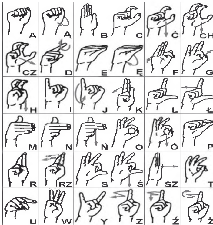
Ryc. 2. Współczesny polski alfabet palcowy (źródło: B. Szczepankowski, Niesłyszący – głusi – głuchoniemi. Wyrównywanie szans , dz. cyt., s. 151.)