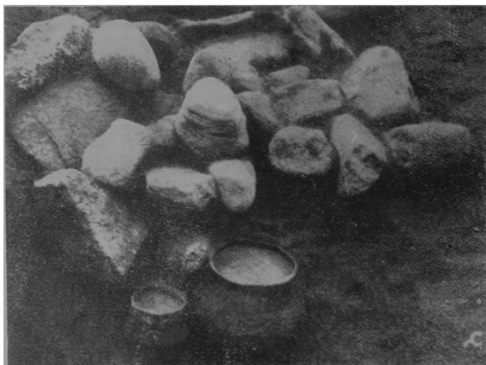
Ryc. 2. Woryty, pow. olsztyński, grób 212. Dwie popielnice pod brukiem kamiennym. Według C. Engla.

cowe, jak i jamowe, przy czym charakterystyczną cechą lokalną jest bardzo wysoki odsetek grobów obwarowanych rozmaitego rodzaju konstrukcjami kamiennymi (Ryc. 2). Rytuał pogrzebowy nakazywał znaczną skromność w ich wyposażeniu: przystawki są bardzo rzadkie, a ich liczba nigdy nie przekracza trzech. Inne dary grobowe występują także sporadycznie — maksymalna liczba grobów z przedmiotami metalowymi na jednym cmentarzysku wynosi 1,5%. Interesujące jest, że również bardzo rzadko występują w tych grobach zabytki z bursztynu. Podobnie rzadko wyposażane są obficie groby w trzech znanych dziś typach kurhanów. Wśród nich wyjątkową pozycję zajmuje kurhan z Workiejmów, pow. lidzbarski, zawierający około sześciuset pochówków, przypadających tak na epokę brązu, jak i na wczesną epokę żelaza. Inne dowody grzebania zmarłych na tych samych obiektach tak przez ludność kultury łużyckiej, jak i kultury po niej następującej, nie są liczne. Istnieją też sugestie o występowaniu na cmentarzyskach łużyckich grobów wcześniejszych. Wracając do kurhanów, stwierdzić trzeba, że dwa pozostałe ich typy mają swoje odpowiedniki w kurhanach z konstrukcjami kamiennymi, występującymi w kulturze łużyckiej na północnym Mazowszu i Pomorzu. Wreszcie wspomnieć tu trzeba o pojawieniu się tzw. grobów symbolicznych oraz o ewentualnych śladach styp, czy ogni obrzędowych na obiektach cmentarnych.