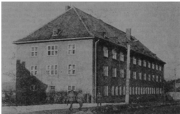
Ryc. 1. Budynek „starej” Polikliniki przy ul. Jagiellońskiej 73