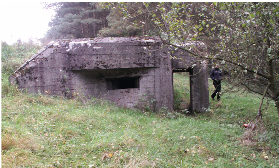
Fot. 1 – schron Pozycji Lidzbark. Po prawej stronie charakterystyczna przelotnia