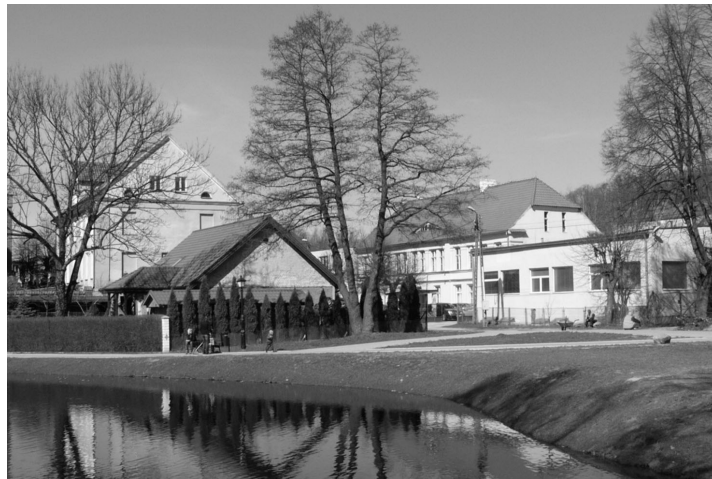
Ryc. 1. Teren dawnego zamku biskupów warmińskich w Barczewie, widok od strony wschodniej, stan z 2009 r. Fot. G. Świdorski

Późnośredniowieczny murowany zamek biskupów warmińskich w Barczewie nie był dotychczas obiektem gruntownych badań naukowych. Wśród przyczyn, które najsilniej oddziaływały na taki stan rzeczy, można wymienić znaczną destrukcję substancji architektonicznej zamku oraz przekształcenia terenu zajmowanego pierwotnie przez ten obiekt. Wobec utrudnień w poznaniu architektury zamku w Barczewie oraz jego układu przestrzennego celowe jest przybliżenie niewykorzystanych dotychczas w polskiej literaturze naukowej źródeł ikonograficznych prezentujących ten obiekt w pierwotnym kształcie, a także ukazujących projekty (zrealizowane bądź niezrealizowane) przekształceń jego substancji architektonicznej. Trzy bardzo cenne źródła ikonograficzne dotyczące tego tematu, będące rysunkową dokumentacją techniczną pochodzącą z pierwszej połowy XIX w., znajdują się w zbiorze dokumentów dawnego Urzędu Konserwatora Zabytków Sztuki i Historii Prowincji Prus Wschodnich (Provinzialkonservator der Denkmäler der Kunst und der Geschichte der Provinz Ostpreussen) przechowywanym w Archiwum Państwowym w Olsztynie 1 . Są to fotokopie dokumentacji oryginalnej sporządzone na potrzeby Urzędu Konserwatora Zabytków Sztuki i Historii Prowincji Prus Wschodnich w bliżej nieokreślonym okresie.