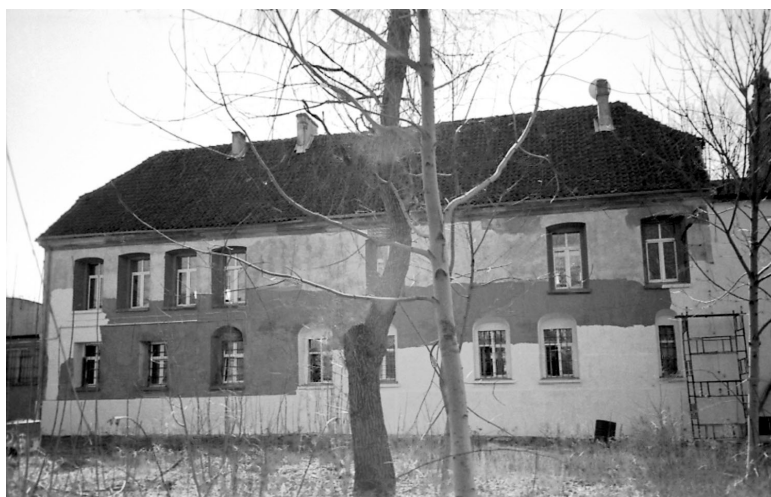
Ryc. 2. Północna ściana dawnego północnego skrzydła zamku biskupów warmińskich w Barczewie, stan z 2003 r.

Trzecią rysunkową dokumentację techniczną stanowi projekt budynku mieszczącego m.in. szkołę ewangelicką (źródło ikonograficzne 3); dokumentacja ocalała tylko we fragmencie. Na zachowanej części dokumentacji brakuje informacji o czasie i autorze jej wykonania. Analiza innych dokumentacji związanych z budową w pierwszej połowie XIX w. kompleksu budynków szkolnych na terenie dawnego zamku biskupiego w Barczewie bądź w jego sąsiedztwie wskazuje, że zachowany fragment dokumentacji został sporządzony przez krajowego mistrza budowlanego Friedricha Leopolda Schimmelpfenniga około 1820 r. Budynek przedstawiony na fragmencie dokumentacji zrealizowano w latach 1826–1832 w miejscu północnego skrzydła dawnego zamku biskupiego w Barczewie 6 . Jak wskazuje analiza zachowanej części dokumentacji oraz ogólna analiza współczesnej substancji architektonicznej tego obiektu, przy jego budowie wykorzystano część zachodniej i północnej ściany północnego skrzydła dawnego zamku biskupiego. Świadczy o tym grubość ścian oraz rozmieszczenie otworów okiennych. Podobna grubość ścian i sposób rozmieszczenia otworów okiennych w północnej ścianie północnego skrzydła dawnego zamku w Barczewie (z drobnymi zmianami) widoczne jest na dokumentacji tego obiektu z 1809 r.