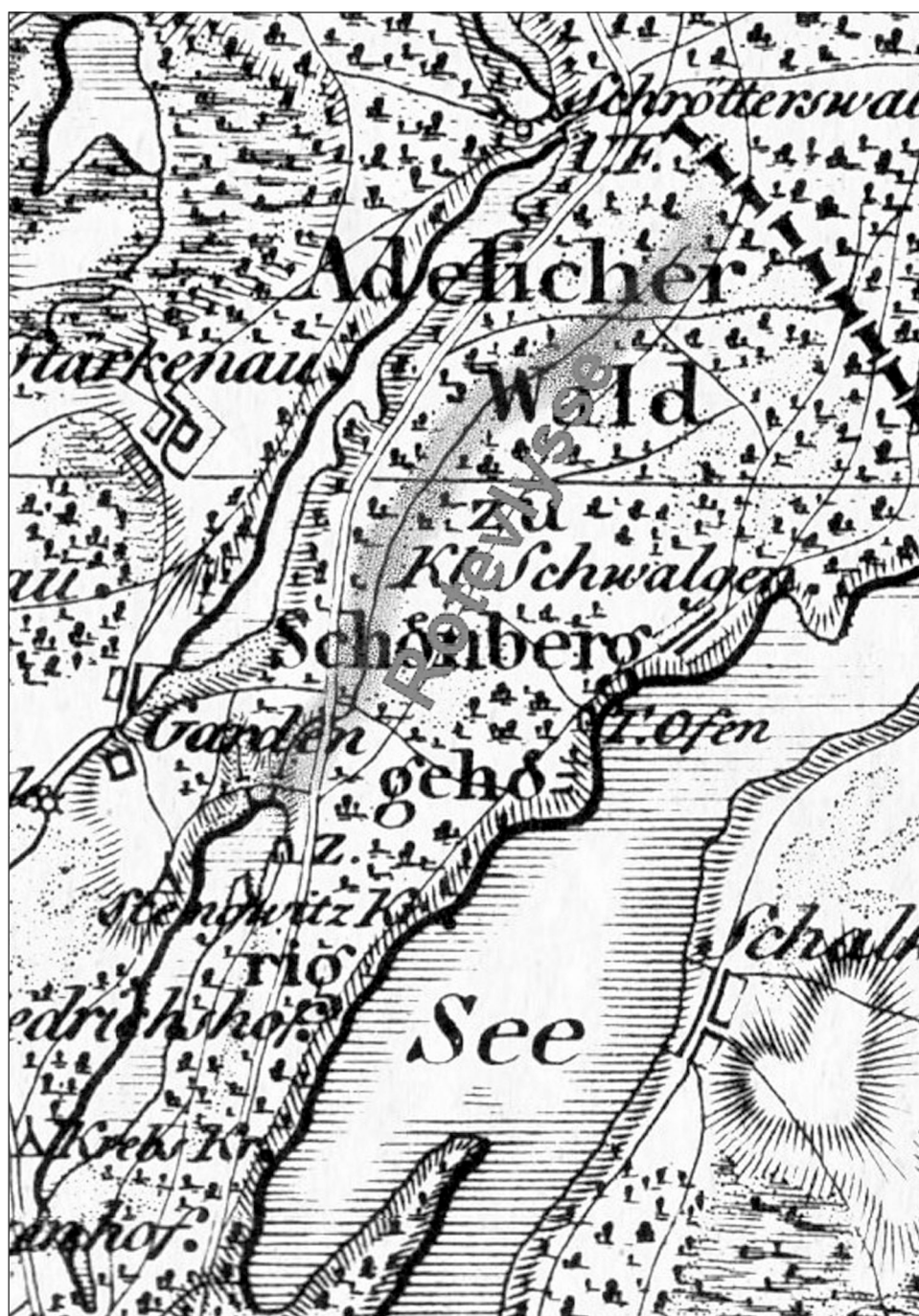
Ryc. 2. Rzeczka Rote flisse wg mapy Schroettera