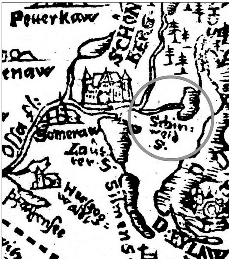
Ryc. 1. Jezioro Schinweid na planie Caspara Hennenbergera