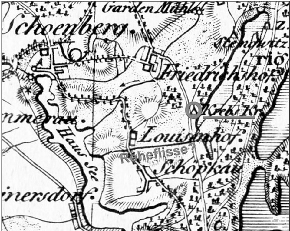
Ryc. 5. Rzeczka Reheflisse i karczma Krebs Krug na granicy dóbr szymbarskich i ławskich w XVI w.