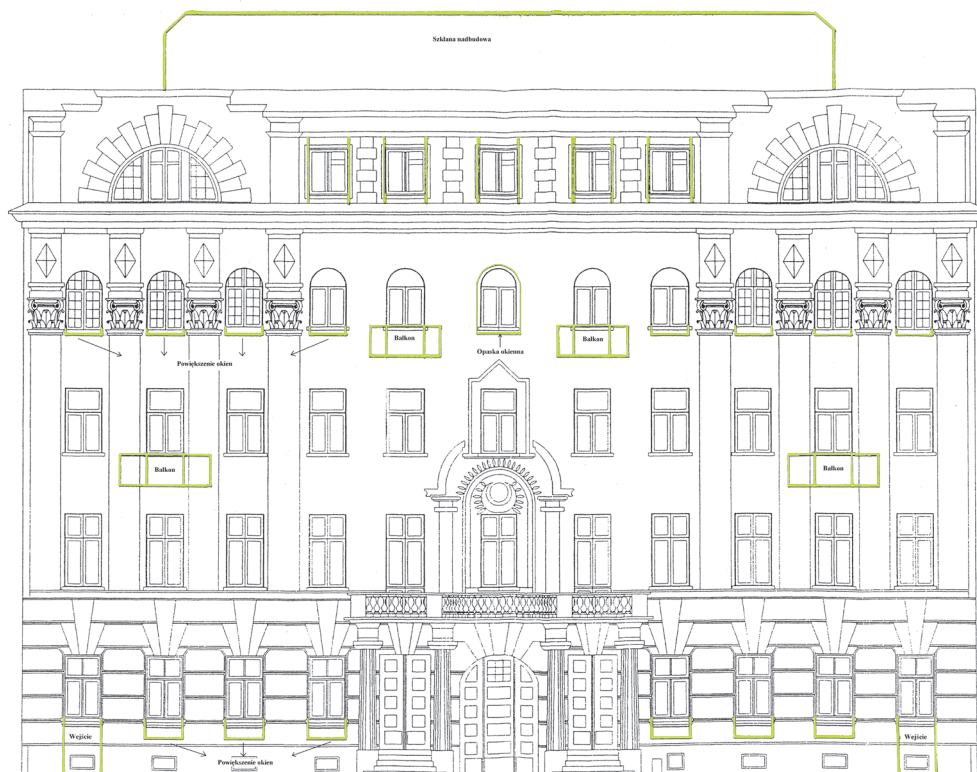
Warszawa, kamienica ul. Poznańska 15, zmiany proponowane na elewacji według pierwszej koncepcji inwestora, rysunek na kopii inwentaryzacji elewacji budynku wykonanej przez projektanta – Studio Gomez, M. Gmiter, wrzesień 2008 r.

Kolejne dyskusje dotyczyły ostatecznej wersji projektu budowlanego i programów konserwatorskich, na podstawie których Stołeczny Konserwator Zabytków mógłby wydać pozwolenie na prace. W projekcie budowlanym z kwietnia 2007 r. przewidziano większość robót wymienianych we wcześniejszych koncepcjach. Główne zmiany dotyczyły urządzenia w zagłębieniu pod dziedzińcem przeciwpożarowego zbiornika wody oraz wejścia do piwnicy z głównej klatki schodowej. W projekcie znalazła się też deklaracja przeprowadzenia remontu historycznego wystroju kamienicy, ale mimo uzgodnienia odpowiedniej ekspertyzy przeciwpożarowej, pozwalającej na pozostawienie niezgodnych z obecnymi przepisami wymiarów klatek schodowych, przewidziano podwyższenie istniejących balustrad, w tym trzech oryginalnych, do przepisowej obecnie wysokości 110 cm. Poza tym, wbrew deklaracji zawartej w projekcie, na rysunku projektowym, w sali na pierwszym piętrze zaplanowano usunięcie oryginalnej ściany ze sztukateriami. Przewidziano też wymianę istniejących jeszcze w części budynku stropów drewnianych na żelbetowe, w tym stropów ze sztukateriami. Zgodnie z programem konserwatorskim zaplanowano obłożenie ścian w bramie płytami z piaskowca oraz wykonanie nowych drzwi głównych o konstrukcji drewnianej, wypełnionej szkłem.