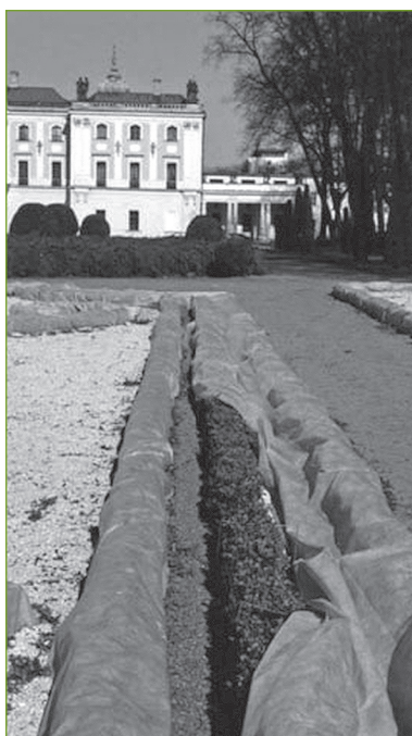
7. Ogród Branickich w Białymstoku. Zabezpieczenie bukszanu agrowłókniną na zimę, 2005 r.

W dotychczasowej praktyce konserwatorskiej rzadko chroniony był krajobraz otaczający barokowe założenia pałacowo-ogrodowe. Wśród nielicznych przykładów można wyróżnić sytuacje, kiedy ogród taki objęty jest szerszym wpisem do rejestru zabytków: urbanistycznym lub ruralistycznym (np. w Wilanowie, w Rydzynie), kiedy park znajduje się w granicach parku kulturowego (park taki ma być utworzony wokół rezydencji wilanowskiej) lub kie-