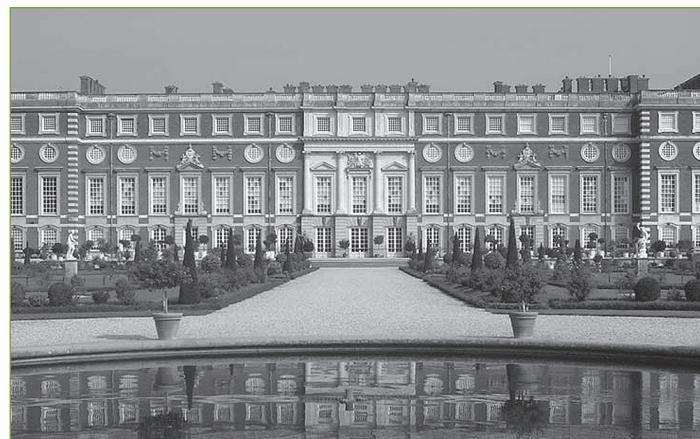
1. Ogród w Hampton Court, stan sprzed przeprowadzenia prac konserwatorskich, 1993 r. (w: S. Thurley, William III's Privy Garden at Hampton Court Palace, research and restoration , Londyn 1995).