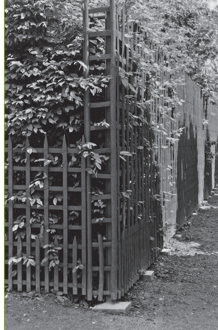
5. Ogród w Hampton Court. Zakładanie szpalerów grabowych, 2006 r.