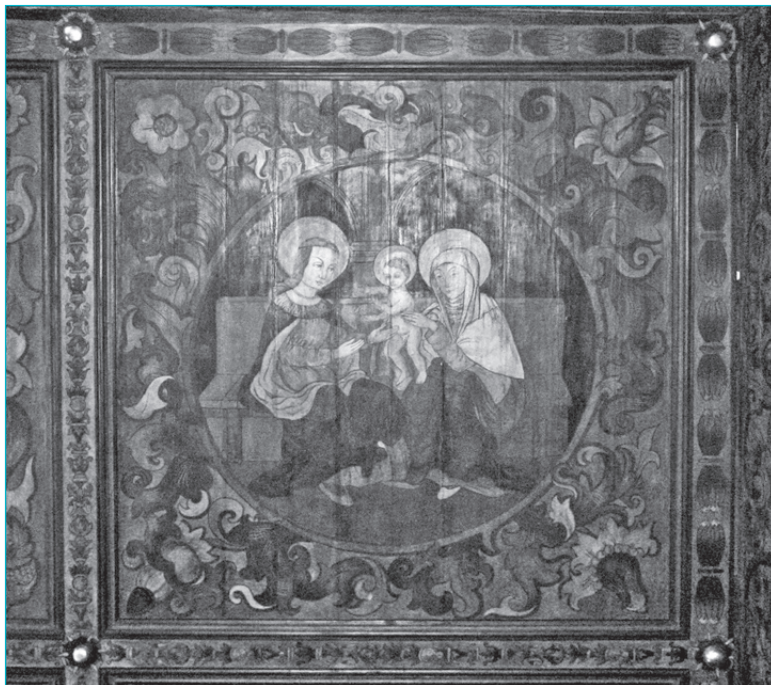
2. Fragment pochodzącej z około 1520 r. polichromii stropu nawy głównej kościoła pw. Narodzenia NMP w Krużłowej z przedstawieniem św. Anny Samotrzeć. Fot. A. Laskowski, 2010

Stan zachowania dekoracji oznaczonej umownie jako IV, z pozoru dobry, wymaga jednak interwencji konserwatorskiej, zwłaszcza w odniesieniu do partii imitujących podziały architektoniczne (płyciny