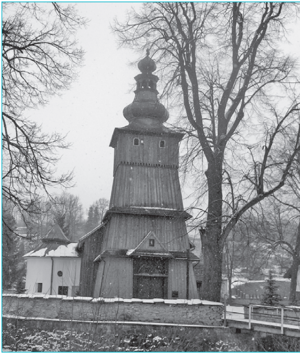
1. Drewniany kościół pw. Narodzenia NMP w Krużlowej – widok ogólny; po lewej stronie murowana kaplica boczna. Fot. A. Laskowski, 2010

tym trójbocznie prezbiterium oraz dobudówkami: prostokątną zakrystią, półkolistą kaplicą od północy i kruchtą od południa oraz dostawioną do korpusu od zachodu kwadratową wieżę.