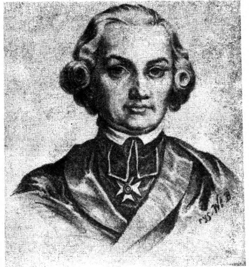
Ryc. 4. Hugo Kołłątaj