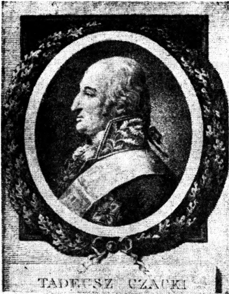
Ryc. 3. Tadeusz Czacki