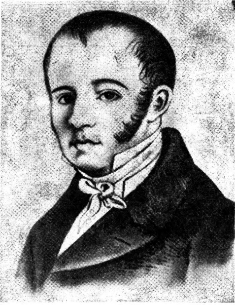
Ryc. 1. Willibald Besser