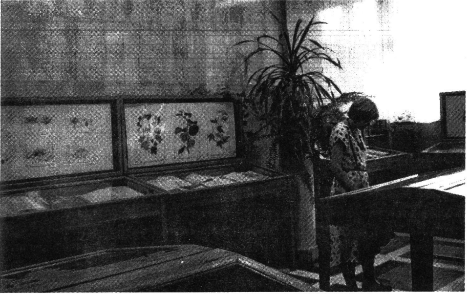
Ryc 1. Fragment wystawy, z rycinami od XVII–XIX w.

osobliwy „zielnik”, pochodzący z ok. 1500 r. p.n.e. był rejestrem roślin przywiezionych przez faraona Thotmesa III ze zwycięskiej wyprawy do Palestyny. Kultura starożytnego Egiptu zna wiele podobnych przedstawień roślin, które można traktować jako najwcześniejsze ilustracje botaniczne. Jednym z najpopularniejszych dzieł o roślinach starożytnego świata była Materia Medica greckiego lekarza Dioskuridesa (Dioscoridesa) (I w. n.e.), kopiowana i komentowana przez ponad tysiąc pięćset lat. Pokazano kilka fotokopii rycin z tej pracy, pochodzących ze sławnego kodeksu wiedeńskiego ( Codex Vindobonensis ), sporządzonego w Konstantynopolu ok. 512 r. n.e. przez Anicię Julianę, córkę cesarza Olybriusa.