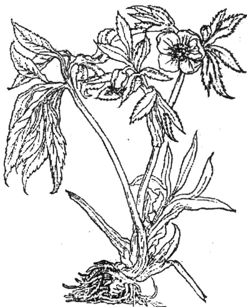
Ryc. 2. Rycina ciemiernika ( Helleborus ) z dzieła Ottona Brunfelsa Herbarum vivae eicones (Argentorati 1530).

służyły do identyfikacji gatunków, stąd ich ogromne znaczenie. W wielu przypadkach wykonywane były przez artystów, zatrudnionych przez autorów lub wydawców, a poziom ich wierności zadziwia do dzisiejszego dnia. Można się było o tym przekonać oglądając ryciny w zielnikach takich autorów jak Teodor Dorstenius (1540), Leonard Fuchs (1542), Mateusz L'Obel (Lobelius) (1576), czy sławny komentator Dioskuridesa Piotr Andrzej Mattioli, którego książka doczekała się kilkudziesięciu edycji (wyeksponowano wydanie z 1562 r.). Szczytowym osiągnięciem szesnastowiecznej ikonografii są wizerunki roślin, wykonane przez malarzy flamandzkich dla wybitnego botanika Karola L'Écluse (Clusiusa), założyciela Ogrodu Botanicznego w Lejdzie, autora wielu publikacji. Ekspozycja zawierała niezwykle cenne oryginały tych rycin (akwarele i gwasze).