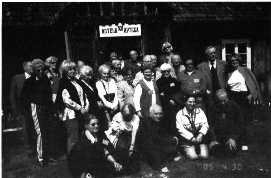
Ryc. 1. Grupa uczestników XIV Sympozjum Historii Farmacji – Słowacja 2005, przed zabytkową apteką z XIX w. w Skansenie w Tokarni – 30.04.2005.