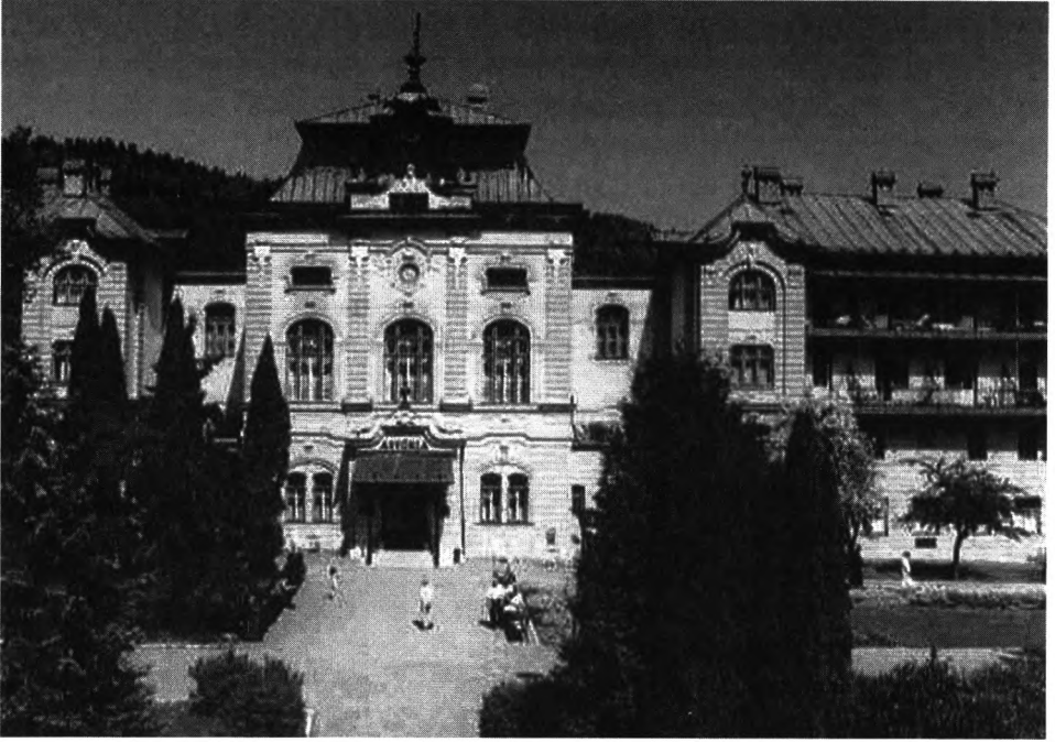
Ryc. 3. Bardejovské Kúpele