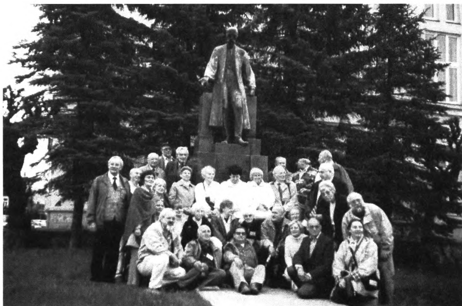
Ryc. 2. Grupa uczestników XIV Sympozjum Historii Farmacji – Słowacja 2005, przed pomnikiem Ignacego Łukasiewicza w Krośnie – 1 V 2005.