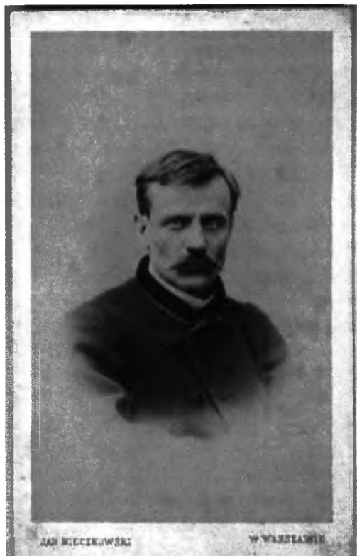
Ryc. 1. Tytus Chałubiński, bez daty, Materiały Tytusa Chałubińskiego, APAN, 63