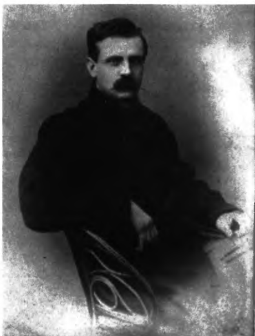
Ryc. 2. Tytus Chałubiński, fotografia, ok. 1870, Materiały Tytusa Chałubińskiego, APAN, 63