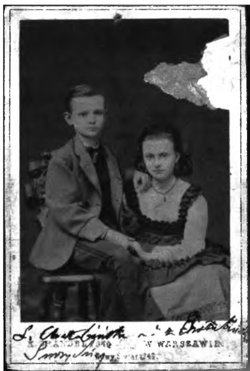
Ryc. 8. Dzieci Tytusa Chałubińskiego - Ludwik i Jadwiga, 1870, Materiały Tytusa Chałubińskiego, APAN, 63