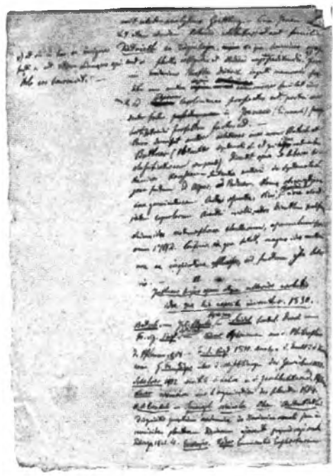
Ryc. 6. Zapiski Tytusa Chałubińskiego w języku łacińskim do prac naukowych, Materiały Tytusa Chałubińskiego, APAN 63