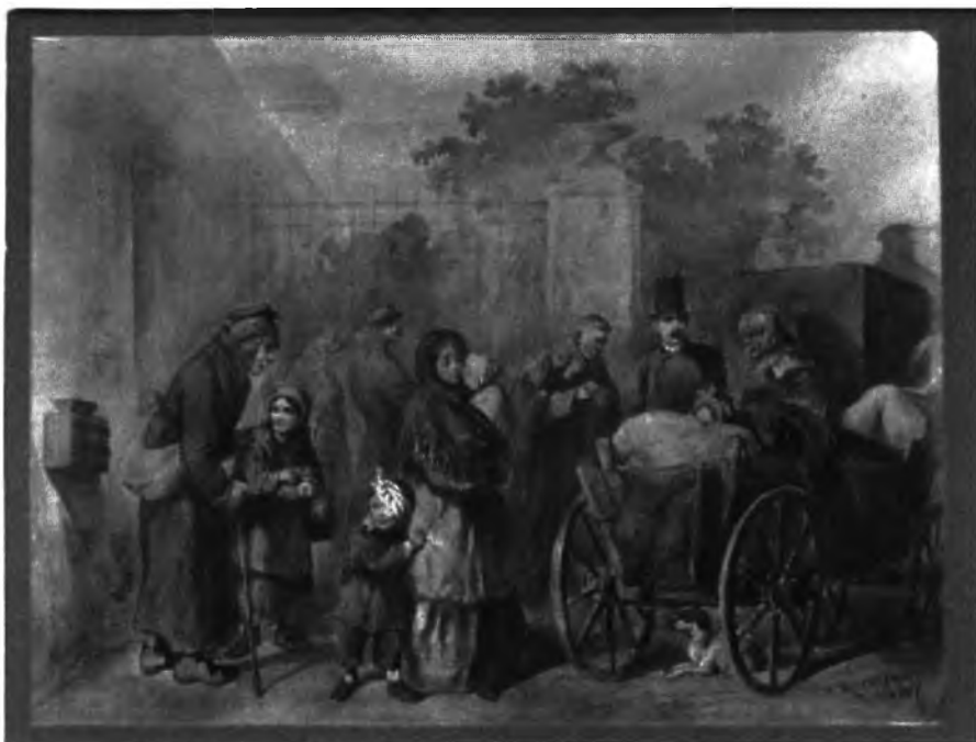
Ryc. 7. Kostrzewski F., Tytus Chałubiński przed Szpitalem Ducha Świętego, fotografia akwareli, po 1867