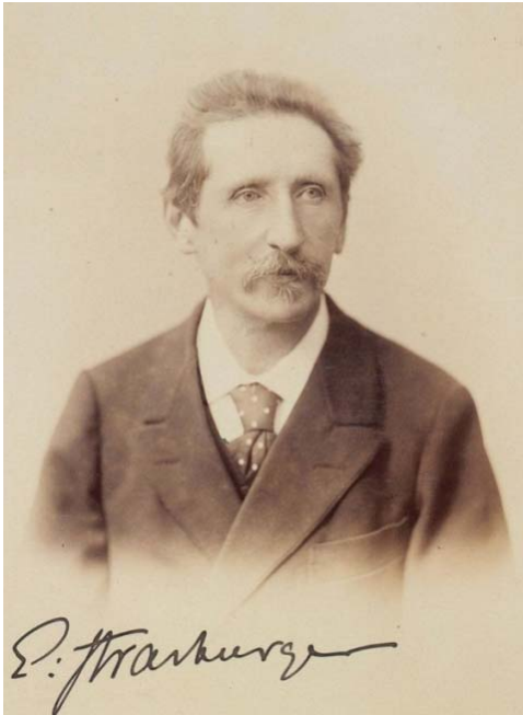
Ryc. 1. Prof. Edward Strasburger – autor jednego z najpopularniejszych podręczników botaniki