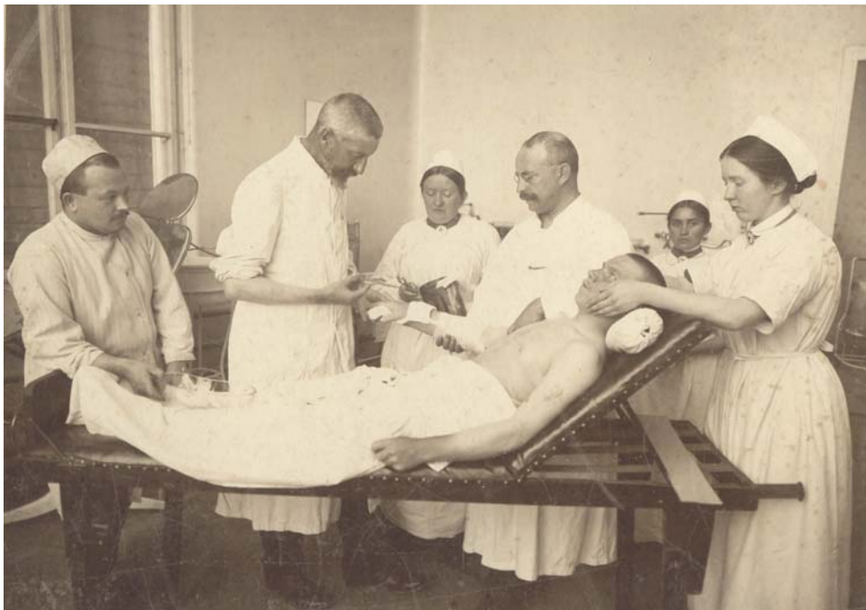
Ryc. 1. Zabieg przeprowadzony przez dr. Hermanna Hinterstoissera i jego zespół