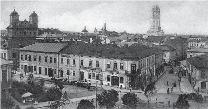
Hotel „Bristol” w Stanisławowie, gdzie mieszkali machnowcy w 1922 r. (pocztówka austriacka).

W Stanisławowie machnowcy byli pod stałym nadzorem policji, jak i wywiadowców cywilnych. Na dzień 19 kwietnia datowane jest pismo starosty stanisławowskiego: