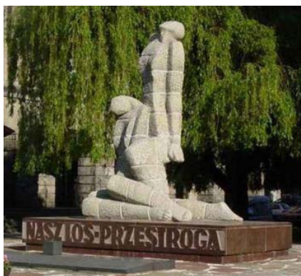
Pomnik pomordowanych profesorów lwowskich we Wrocławiu, autorstwa Borysa Michałowskiego 5