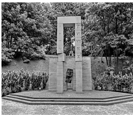
Pomnik we Lwowie autorstwa Aleksandra Śliwy, poświęcony rozstrzelanym profesorom lwowskim 6