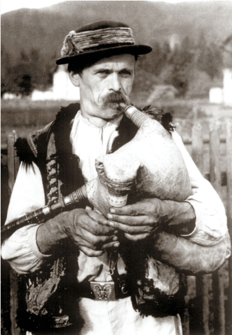
Dudziarz huculski, Worochta – lata trzydzieste XX w.

Na głowie kresania o niskiej główce i dość wąskim rondzie z różnobarwnymi bajorkami . Długa, wypuszczona na spodnie biała koszula bez haftowanych oszewek. Keptar ciemny, zdobiony barwnymi aplikacjami i haftami. Na koszuli zapięty austro-węgierski skórzany pas wojskowy z charakterystyczną klamrą z dwugłowym, Cesarsko-Królewskim, orłem. Widoczne są także dudy.