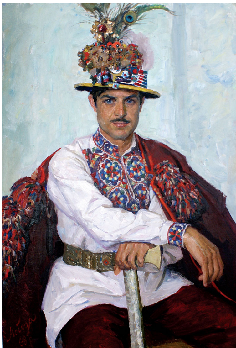
I.I. Łoboda, Pan młody , olej na płótnie, 1964 r.

Pomimo trudności związanych z okresem sowieckim widoczne są niemal wszystkie atrybuty odświętnego huculskiego stroju męskiego, mianowicie kapelusze z bajorkami i bogatym przystrojem, bogato haftowana soroczka oraz czerwony serdak i kraszanyci . W ręku sokirka .