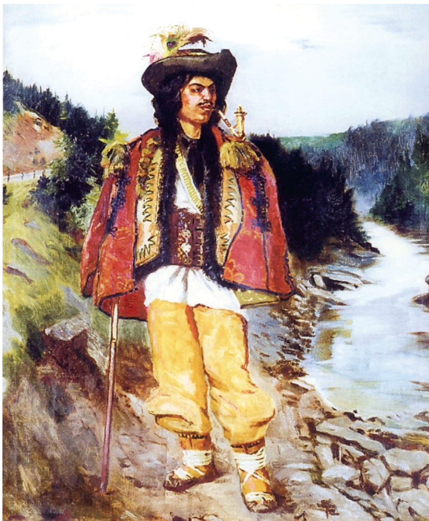
Seweryn Obst, Hucul , olej na płótnie. Własność prywatna.

Typowa sylwetka młodego Hucula z początków XX w. Na głowie czarna, filcowa kresania z dość szerokim i podwiniętym do góry rondem oraz z przystrojem w postaci piór, zapewne również pawich. Na ramiona narzucony czerwony, zdobiony aplikacjami i frędzlami serdak , pod nim keptar . Na białej koszuli wypuszczonej na spodnie szeroki pas czeres . W rękę zapewne bardka lub kielef bądź też palica . Spodnie letnie – haczi – zapewne barwy żółtej. Na nogach typowe huculskie postoty . Przez prawe ramię do lewego boku pas od torby – być może typu taszka .