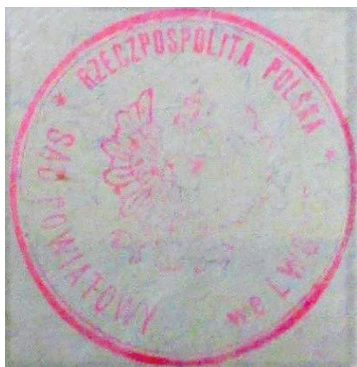
Pieczęć Sądu Powiatowego we Lwowie z Державний Архів Івано-Фраківської Області (DAIFO), fond 635, opis 1, sprawa 10, k. 10.