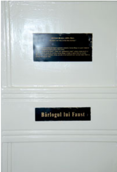
Drzwi w bibliotece prowadzące do pokoju, w którym przetłumaczono na język rumuński Fausta Goethego, fot. Lech W. Szajdak, archiwum rodzinne

Cluj-Napoca jest miastem położonym w północno-zachodniej Rumunii, na Wyżynie Transylwańskiej nad Małym Samozem. Jest to największe miasto i historyczna stolica Siedmiogrodu oraz ośrodek administracyjny okręgu Cluj.