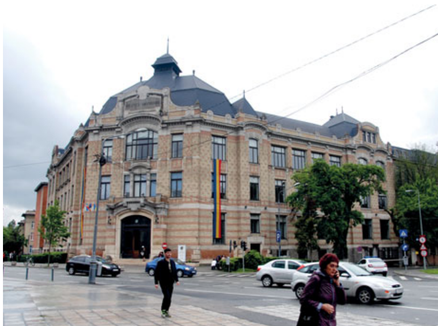
Budynek Centralnej Biblioteki Uniwersyteckiej im. Luciana Blagi w Cluj-Napoca

4 października 2022 roku w Centralnej Bibliotece Uniwersyteckiej im. Luciana Blagi w Cluj-Napoca (Rumunia) odbył się wernisaż wystawy poświęconej Grupie Poetyckiej „Wołyń”. Biblioteka założona została w 1872 roku.