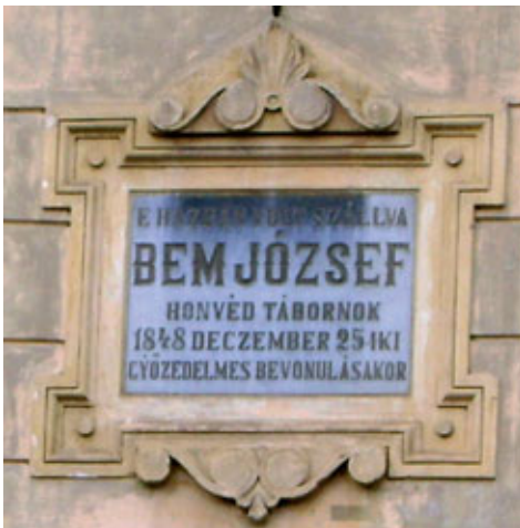
Tablica informująca o pobycie 25 grudnia 1848 roku w Cluj-Napoca Józefa Bema

Miasto ma wiele związków z polską historią i kulturą, których ślady można dziś odnaleźć. 25 grudnia 1848 roku w tym mieście przebywał Józef Bem, co zostało udokumentowane informacją na tablicy znajdującej się w centrum miasta.