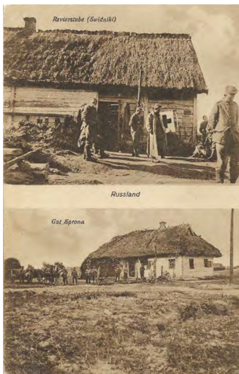
38. Świdniki. Poczta ukazuje codzienne życie żołnierzy na froncie wschodnim. Karta wydana przez Paula Voigta z Lipska