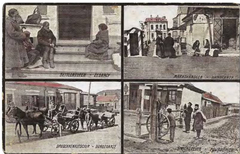
33. Karta pocztowa o charakterze obyczajowym, ukazująca różne typy i zawody mieszkańców Łucka (żebracy, handlarze, dorożkarze, powroźnicy). Pocztówkę opublikował S. Gorochowski, który w okresie I wojny światowej był wydawcą najładniejszych i najciekawszych kolorowych kart pocztowych w Łucku