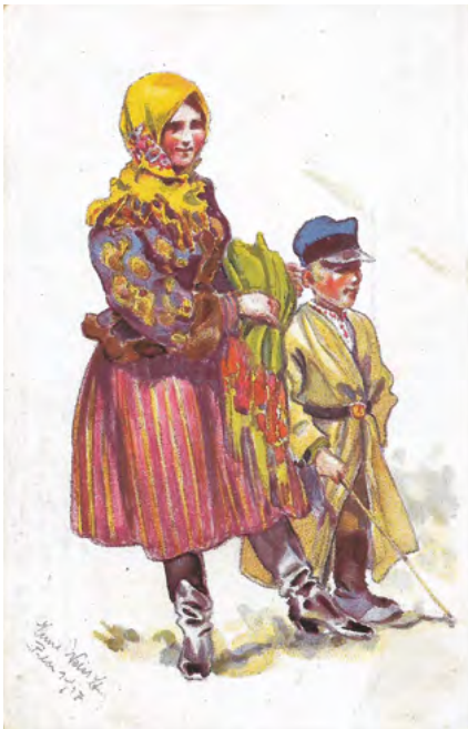
24. Karta pocztowa z 1917 r. z serii „Wolhynische Typen” („Typy mieszkańców Wołynia”) z obrazami pędzla niemieckiego malarza Emila Rudolfa Weissa. Druk. Karl Harbauer, Wiedeń