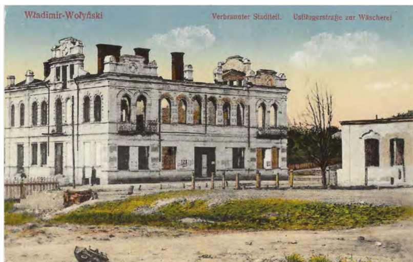
17. Zniszczony przez działania wojenne fragment ulicy Uściługskiej we Włodzimierzu Wołyńskim. Wydawca nieznany