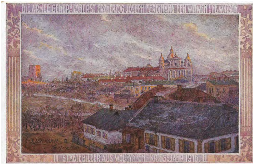
28. Wydana w 1916 r. pocztówka z serii „Wolhynien Städtebilder”. Na karcie pocztowej pejzaż Łucka pędzla J. Lehmana. Druk widokówki – Edward Strache, Warnsdorf