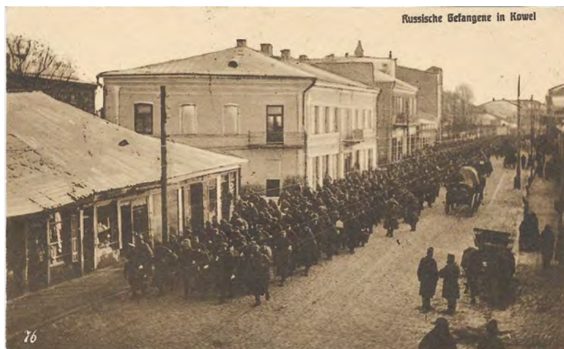
5. Karta pocztowa o charakterze propagandowym, ilustrująca zwycięstwa odnoszone w czasie I wojny światowej przez armię austro-węgierską – tu jeńcy rosyjscy ciągnący długą kolumną ulicami Kowla. Poczta wydana w Berlinie