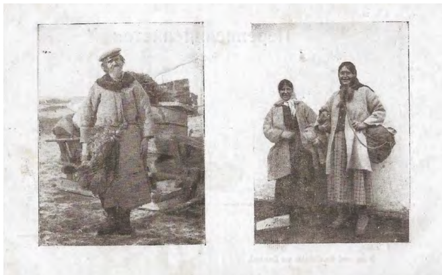
41. Typy mieszkańców Wołyńia – Poleszycy. Seria II, nr 12. Karta pocztowa wydana przez Narodowy Komisariat Ukraińskich Strzelców Siczowych we Włodzimierzu Wołyńskim. Dochód ze sprzedaży pocztówki przeznaczony na ukraińskie szkoły na Wołyńiu