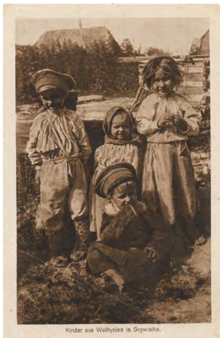
13. Dzieci z Hrywiatki w gminie Powursk w powiecie kowelskim. Kartę pocztową wydano w czasie I wojny światowej w Berlinie. Seria o charakterze etnograficznym pod hasłem „Koczeniczny – Wolhynien” prezentuje rdzennych mieszkańców Wołnyia