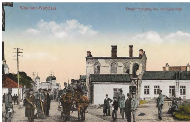
18. Sprzątanie po ostrzale ulicy Uściługskiej we Włodzimierzu Wołyńskim. Wydawca karty pocztowej nieznany