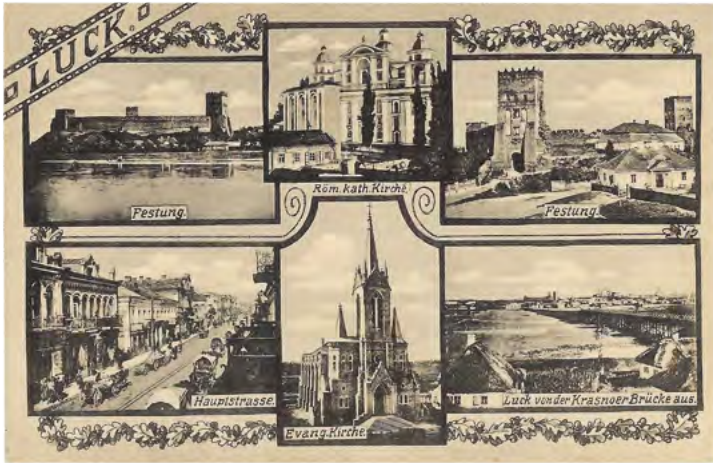
1. Kolaż, ukazujący Łuck w okresie I wojny światowej. Na karcie pocztowej w wieniec z dębowych liści w artystyczny sposób wkomponowano aż sześć widoków stolicy Wołynia. To: zamek Lubarta, katedra, baszta zamkowa, główna ulica miasta, kościół ewangelicki oraz Most Kraśnieński. Pocztówkę wydał G. Liberman