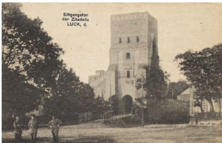
37. Pamiątkowe zdjęcie zwycięzców pod zamkiem Lubartowa. Wydawca karty pocztowej nieznany