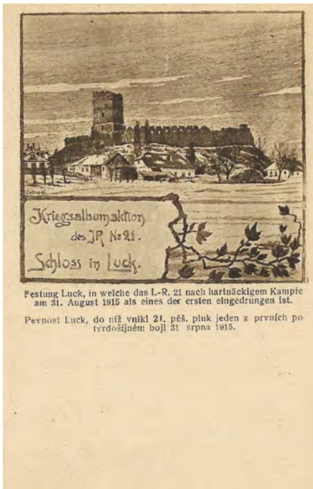
36. Karta pocztowa o charakterze propagandowym z okresu I wojny światowej, informująca o zajęciu 31 sierpnia 1915 r. twierdzy Łuck