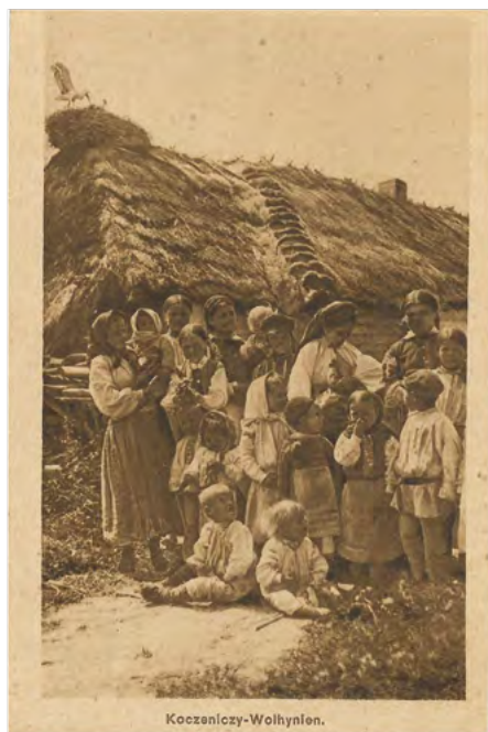
14. Karta pocztowa z wydanej w czasie I wojny światowej w Berlinie serii „Koczeniczny – Wolhynien”, ukazującej rdzennych mieszkańców Wołnyia