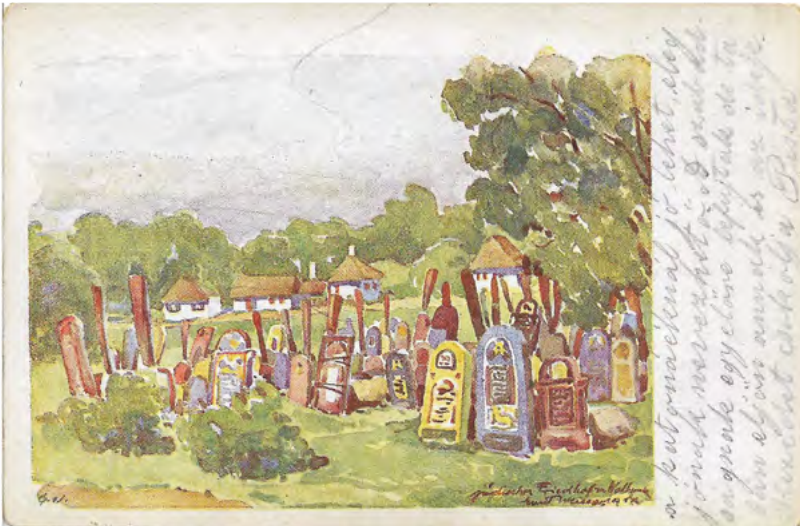
23. Żydowski kirkut na Wołyniu. Karta pocztowa z 1917 r. z serii „Wolhynische Städtebilder” („Widoki wołyńskich miast”) z obrazami pędzla niemieckiego malarza Emila Rudolfa Weissa