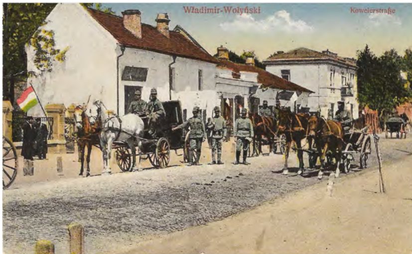
16. Przejazd wojska ulicą Kowelską we Włodzimierzu Wołyńskim w czasie I wojny światowej. Wydawca nieznan