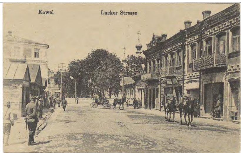
6. Ulica Łucka w Kowlu. Widokówka z okresu I wojny światowej. Na koniach i przy sklepie żołnierze niemieccy w charakterystycznych pikielhaubach. Karta pocztowa opublikowana przez Wydawnictwo A. Pfeifferra w Berlinie