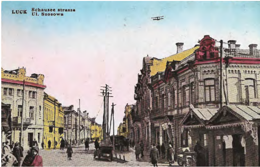
35. Łuck. Ulica Szosowa. Ciekawa karta pocztowa z przelatującym aeroplanem. Wyd. S. Gorochowski, Łuck