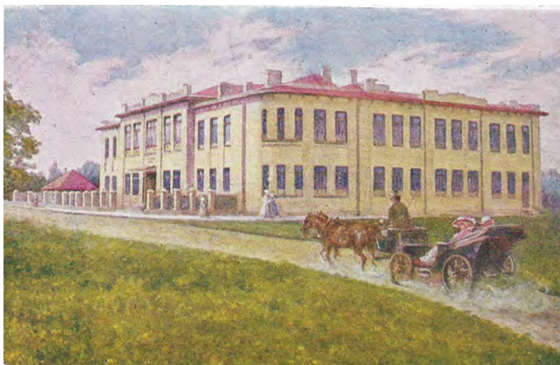
31. Gimnazjum Żeńskie. Wyd. Szymon Aszkienazy, Kowel