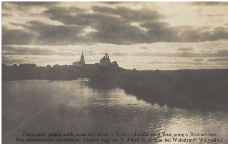
40. Stary monastyr zbudowany w X w. w Zimnem koło Włodzimierza Wołyńskiego. Seria I, cz. 5. Widokówka wydana nakładem Komisariatu Ukraińskich Strzelców Siczowych we Włodzimierzu Wołyńskim (w okresie I wojny światowej Ukraińcy w ramach armii austro-węgierskiej rozpoczęli walkę o własne państwo). Dochód ze sprzedaży karty pocztowej przeznaczony na ukraińskie szkoły na Wołyniu