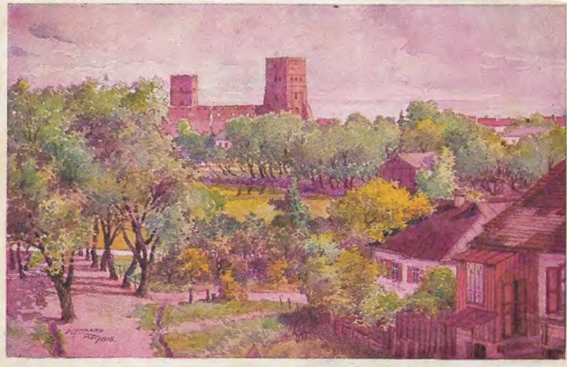
27. Karta pocztowa z serii „Wolhynische Städtebilder” („Widoki wołyńskich miast”) z namalowanym przez J. Lehmana widokiem Łucka. Druk widokówki Edward Strache, Warnsdorf