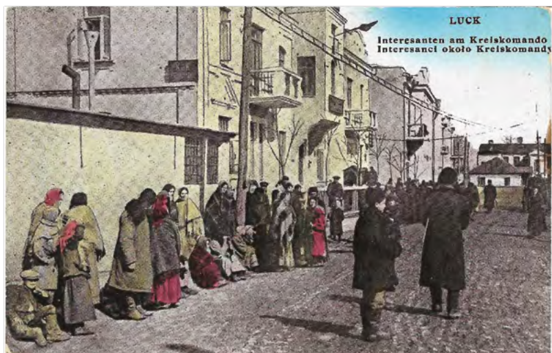
34. Karta pocztowa o charakterze reportażowym, przedstawiająca interesantów, czekających pod Kreiskomando w Łucku. Wyd. S. Gorochowski, Łuck