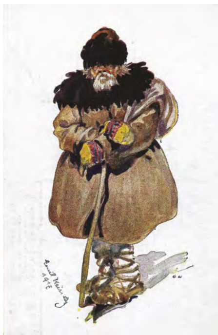
26. Karta pocztowa z 1917 r. z serii „Wolhynische Typen” („Typy mieszkańców Wołynia”) z obrazami pędzla niemieckiego malarza Emila Rudolfa Weissa. Druk. Karl Harbauer, Wiedeń