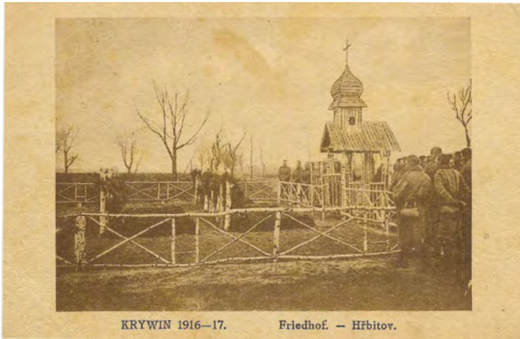
39. Krywin 1916–1917. Pożegnanie towarzyszy broni, poległych w trakcie działań wojennych, na cmentarzu w Krywinie. Wydawca nieznany