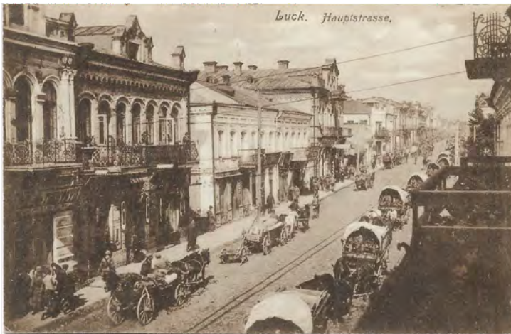
12. Wojsko długą kolumną wozów ciągnące główną ulicą Łucka. Kartę pocztową wydał G. Liberman