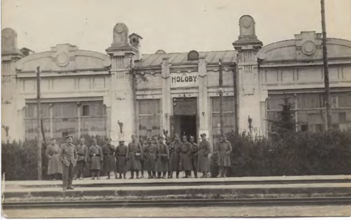
11. Wojsko w oczekiwaniu na transport na dworcu kolejowym w Hołobach. Wydawca karty pocztowej nieznany