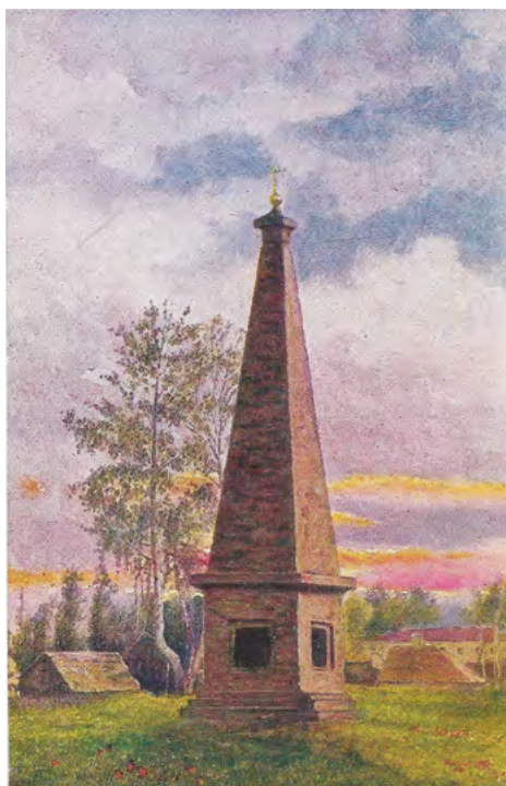
32. Pomnik Wojny Napoleńskiej.