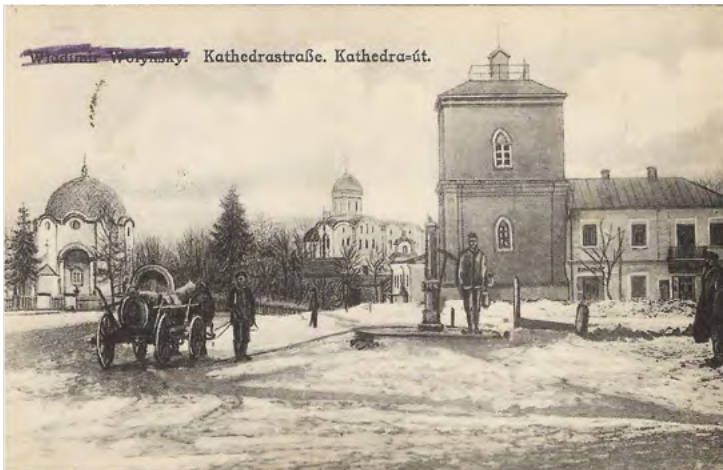
2. Scenka rodzajowa z Włodzimierza Wołyńskiego z okresu walk o miasto w czasie I wojny światowej – wozivoda nabiera wodę do gaszenia pożarów z miejskiego ujęcia na ulicy Katedralnej. Kartę pocztową z napisami w języku niemieckim i węgierskim wydali Low & Stern z Włodzimierza Wołyńskiego. Została wydrukowana w Wiedniu. Z frontu wołyńskiego wysłano ją na Węgry