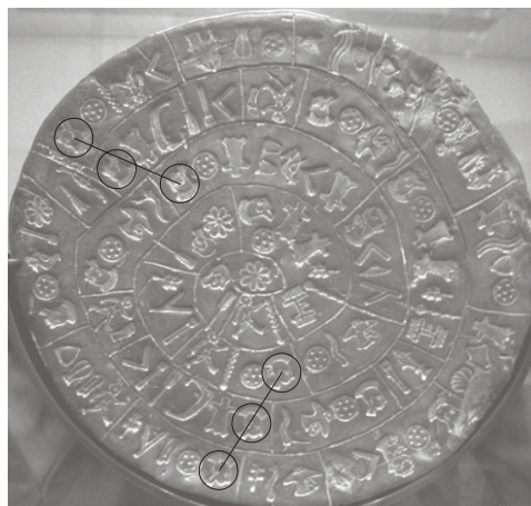
Rysunek 1. Zaznaczone na stronie A dysku z Fajstos dwa odcinki linii prostej wyznaczone przez trzy umieszczone kolejno jeden nad drugim znaki nr 2 (opracowanie własne).

W opinii autora w przypadku dysku z Fajstos najbardziej zastanawiające są liczne wzory geometryczne, które można dostrzec zwłaszcza na jego stronie A (zob. A. Kondratow 1988). Na przykład, na stronie A dysku z Fajstos znak przedstawiający głowę wojownika w hełmie z pióropuszem (znak nr 2) w dwóch miejscach, pokazanych na rysunku 1, zdaje się tworzyć dwa odcinki linii prostej, z których każdy składa się z trzech tego typu znaków, ułożonych jeden nad drugim w kolejnych zwojach linii spiralnej (zob. A.T. Cate 2011).