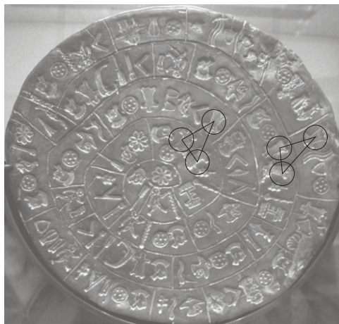
Rysunek 2. Zaznaczone na stronie A dysku z Fajstos dwa trójkąty wyznaczone przez trzy umieszczone w swoim bezpośrednim sąsiedztwie znaki nr 27 (opracowanie własne).

Podobnie, w dwóch innych miejscach na stronie A dysku z Fajstos grupy trzech znaków przedstawiających wizerunek wygarbowanej wołowej skóry (znak nr 27) tworzą dwa trójkąty zbliżone swym kształtem do trójkątów prostokątnych, co zostało pokazane na rysunku 2.