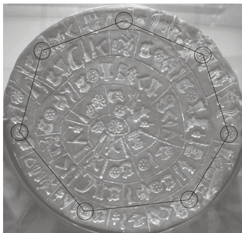
Rysunek 3. Zaznaczony na stronie A dysku z Fajstos siedmiokąt, zbliżony w swym kształcie do siedmiokąta foremnego, w którego wierzchołkach tkwią znaki nr 12 (opracowanie własne).

Jednak najbardziej zagadkowym w swej postaci wzorem geometrycznym, występującym na stronie A dysku z Fajstos, jest w miarę regularny siedmiokąt, zbliżony swym kształtem do siedmiokąta foremnego, w którego wierzchołkach znajdują się znaki przedstawiające wizerunek tarczy (znak nr 12). Rozważana figura geometryczna, przypominająca swym kształtem siedmiokąt foremny, została uwidoczniiona na rysunku 3.