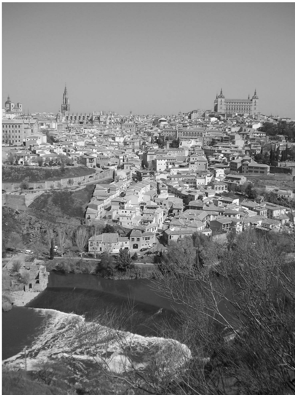
II. 2. Toledo, panorama miasta z rzeką Tag; fot. archiwum autora.