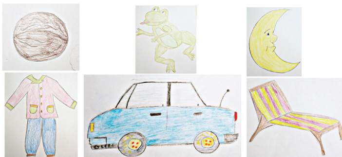
RYSUNEK 1. Przykładowy garaż

Chłopiec przynosi trzy ulubione samochody. Następnie dla każdego wybiera po pięć obrazków. Na każdym znajdują się rysunki zawierające ćwiczoną głoskę. Zadaniem dziecka jest zbudowanie garażu i opowiedzenie o tym, co znajduje się na obrazkach.