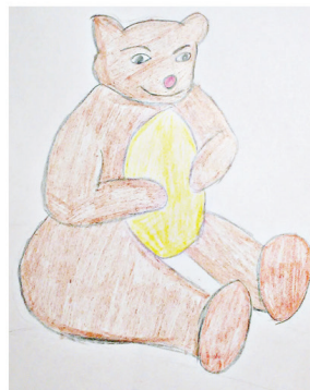
RYSUNEK 3. „Zabawki idą na zakupy”

ŹRÓDŁO: Zabawa (opracowanie własne), obrazki (opracowanie własne)