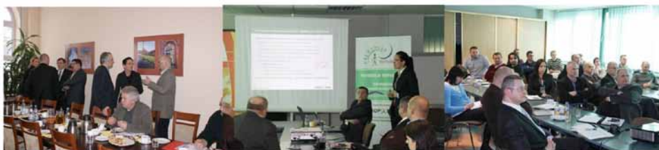
Fotografia 1. Spotkania z przedstawicielami firm podwykonawczych Gaz-System S.A.

Spotkania pod wspólnym tytułem „Bezpieczeństwo i higiena pracy oraz zarządzanie środowiskiem w zakresie współpracy z podwykonawcami realizującymi prace gazoniebezpieczne” były organizowane w siedzibach oddziałów spółki w Poznaniu, Tarnowie i w Warszawie. W sumie uczestniczyło w nich 20 firm podwykonawczych GAZ-SYSTEM S.A. (ok. 70 osób). Ideą każdego ze spotkań było otwarte komunikowanie norm i wartości Spółki w zakresie bezpieczeństwa pracy, jasne przedstawienie wymagań i zachęcenie podwykonawców do rozmowy na ich temat. W każdym z oddziałów omawiano rozwiązania organizacyjne z zakresu bhp oraz zarządzania środowiskowego obowiązujące firmy podwykonawcze, a także aspekty bhp i ochrony środowiska podczas wykonywania prac na obiektach sieci przesyłowej GAZ-SYSTEM S.A. Przedstawiciele firm podwykonawczych przedstawiali zastrzeżenia oraz wątpliwości dotyczące stawianych im wymagań z zakresu bezpieczeństwa pracy oraz ochrony środowiska, z których większość była wyjaśniana na miejscu. Otrzymywali także szczegółowe informacje na temat tego, gdzie w GAZ-SYSTEM S.A. mogą szukać wsparcia w zakresie realizowanych przez nich prac.