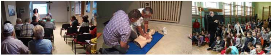
Fotografia 2. Działania zrealizowane przez „Partnerstwo na rzecz prewencji wypadkowej”.

Zespół zadaniowy został utworzony również w Olsztynie, jednak w odróżnieniu od Ostrołęki w jego skład weszło 45 przedsiębiorstw i instytucji z całego kraju (nie tylko z jednego regionu). Większość z tych przedsiębiorstw w ciągu roku samodzielnie realizowała wybrane cele kampanii „Prewencja wypadkowa” prowadząc działania z zakresu prewencji wypadkowej na rzecz swoich pracowników, jednak dla zwieńczenia prowadzonych działań włączyła się w zorganizowanie pikniku edukacyjnego pn. „Prewencja wypadkowa - kultura bezpieczeństwa”. Piknik odbył się w dniu 7 września 2012 r. na terenie Uniwersytetu Warmińsko-Mazurskiego. Pracami zespołu kierowała grupa 4 partnerów – instytucji działających w obszarze bezpieczeństwa pracy (Ogólnopolskie Stowarzyszenie Pracowników Służby BHP Oddział w Olsztynie, Centralny Instytut Ochrony Pracy, Okręgowa Inspekcja Pracy z Olsztyna oraz Urząd Dozoru Technicznego). W przedsięwzięciu wzięło udział ok. 1000 osób.