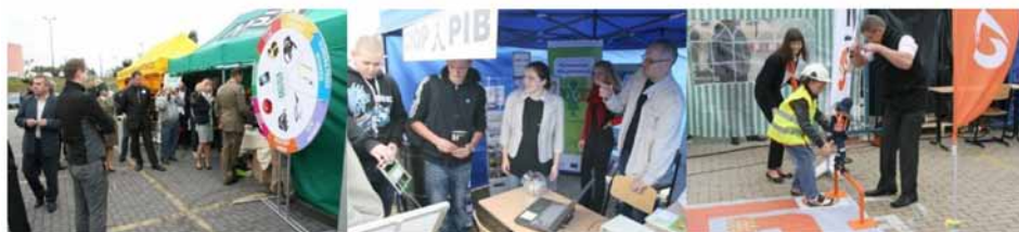
Fotografia 3. Piknik edukacyjny „Prewencja wypadkowa – kultura bezpieczeństwa”.

Na pikniku można było poza tym obejrzeć środki ochrony indywidualnej, sprawdzić się w konkursach wiedzy oraz zapoznać się z przykładami dobrych praktyk bhp z zakresu prewencji wypadkowej, prezentowanymi w namiocie wykładowym m.in. przez przedstawicieli UDT z Olsztyna, Grupy Żywiec S.A. Browaru w Elblągu, Gaz-System S.A, Michelin Polska S.A. czy Olsztyńskich Kopalni Surowców Mineralnych Sp. z o.o.