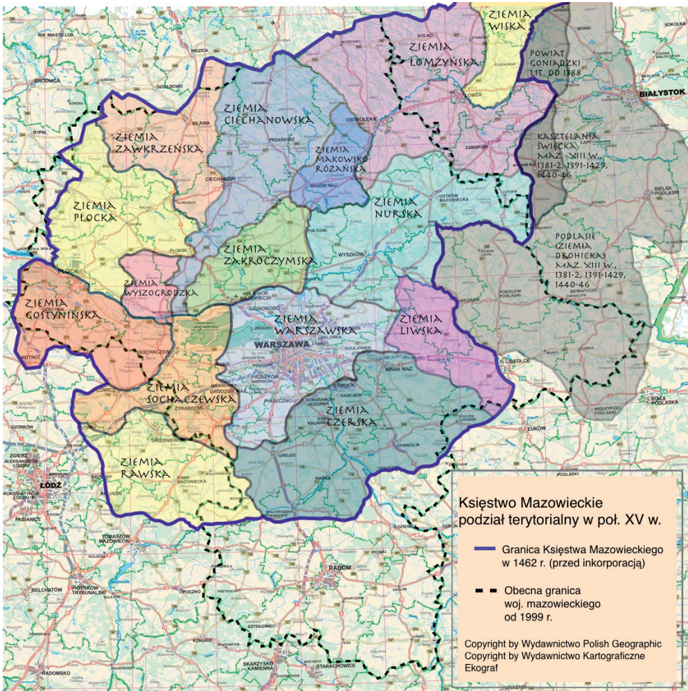
Ryc. 1. Granice historycznego Mazowsza naniesione na obszar obecnego zasięgu województwa mazowieckiego