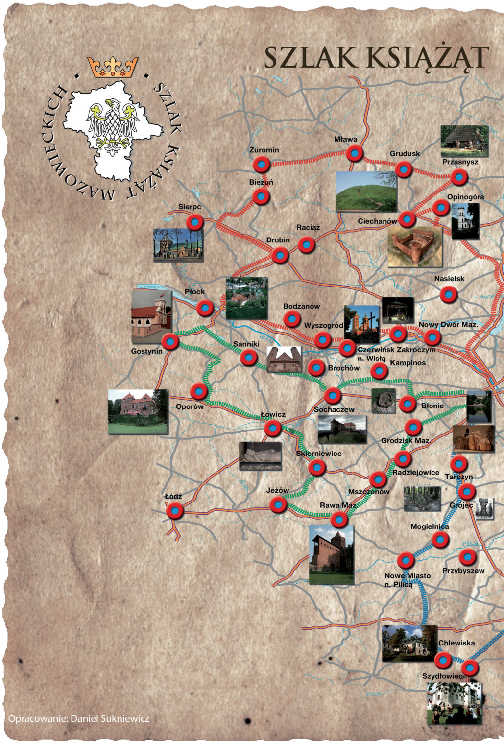
Ryc. 2. Stylizowana mapa Szlaku Książąt Mazowieckich