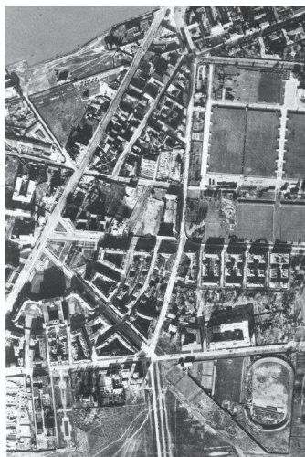
Ryc. 1. Pl. Narutowicza w szerszym kontekście przestrzennym – stan przed 1939 r.

Plac usytuowano „frontem” do ul. Grójeckiej i wyprowadzono stąd istniejące już ul. Filtrową oraz ul. Barską po stronie zachodniej oraz nowoprojektowane – ul. Uniwersytecką i niewielką ul. Supińskiego. Wewnętrzna ul. Akademicka niejako zamknęła plac, otaczając go łukiem od strony wschodniej. Półkolistą formę placu wzmocniło powtórzenie kształtu ulicą Mochnackiego na drugim planie. W kontekście powiązań przestrzennych i widokowych główny trzon kompozycji stanowiły ulice Filtrowa i Uniwersytecka, skoncentrowane na głównej dominancie placu – kościele pw. Niepokalanego Poczęcia Najświętszej Marii Panny (Ryc. 1., Ryc. 2.). Szczególną rolę wyznaczono ul. Uniwersyteckiej – miała stanowić główną arterię łączącą Ochotę z Mokotowem, biegnąc przez Pole Mokotowskie aż do planowanej Al. Niepodległości