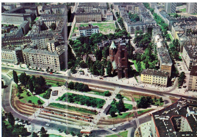
Ryc. 12. Plac Narutowicza w latach 70. XX w.