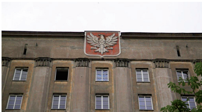
Ryc. 15. Gmach „Akademika” – zwieńczenie elewacji frontowej; godło (orzeł bez korony) umieszczone po 1945 r.

W sąsiedztwie placu Narutowicza znajdują się obszary i obiekty wpisane do rejestru zabytków: układ urbanistyczny Kolonia Lubeckiego, zespół urbanistyczno-architektoniczny Reduta Wawelska. W bezpośrednim otoczeniu placu, ze względu na swoje wartości