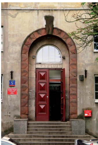
Ryc. 16. Detal architektoniczny – wejście główne do gmachu „Akademika”