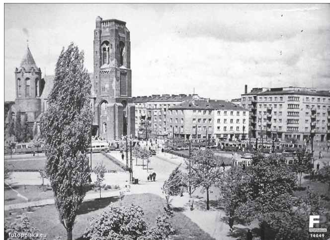
Ryc. 10. Widok na plac w trakcie odbudowy, 1947 r. Na pierwszym planie – zachowany regularny szpaler topól przed wejściem do Domu Akademickiego