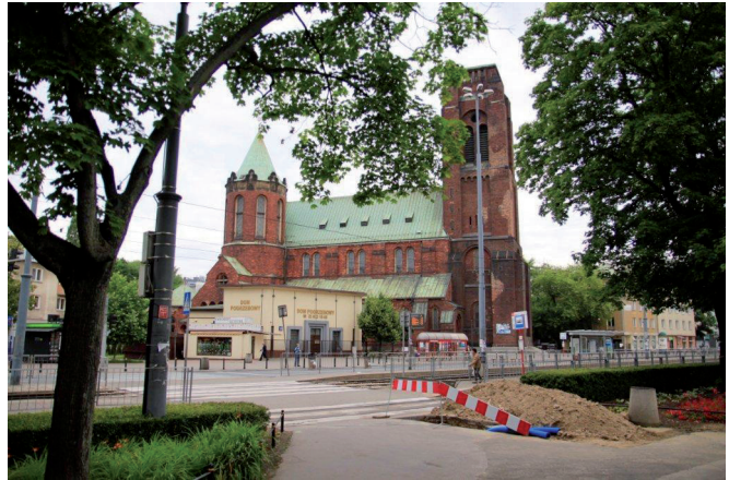
Ryc. 17. Gmach kościoła i „zgrzyt” architektoniczny od strony południowej

Większość elementów wyposażenia (latarnie, bariery itp.) i niewielkie obiekty kubaturowe (pawilony), znajdujące się na placu, nie spełnia dziś dostatecznie swoich podstawowych funkcji, biorąc pod uwagę względy techniczne i estetyczne. Interesującym elementem wystroju jest zachowany oryginalny przedwojenny słup trakcji tramwajowej – ze względu na specyfikę Warszawy i jej niewyobrażalne straty wojenne ten niewielki obiekt jest czymś niezwykle cennym i unikatowym (Ryc. 19.).