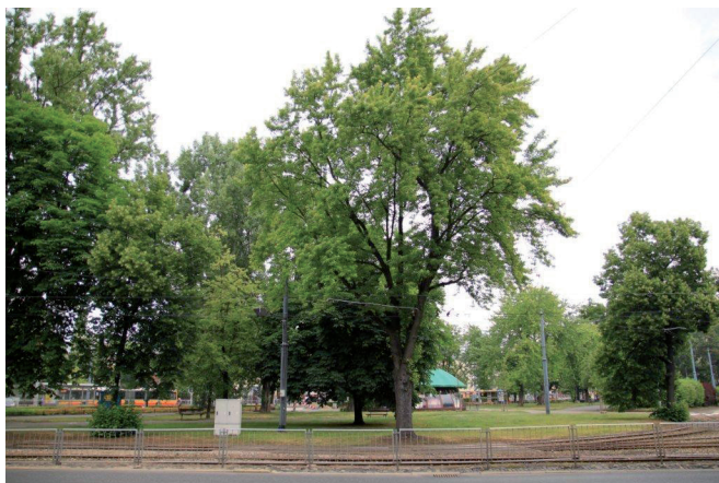
Ryc. 20. Zadrzewienia w centralnej części placu

Równolegle wzdłuż tego fragmentu ul. Akademickiej rośnie 13 drzew w bardzo dobrym stanie zdrowotnym. Dominuje tu lipa drobnolistna (9 szt., obwód ok. 100 cm), a towarzysząco występuje jarzab mączny (4 szt., obwód ok. 70 cm). W sąsiedztwie ulicy wskazać można jedynie 5 drzew w pogorszonym lub złym stanie zdrowotnym.