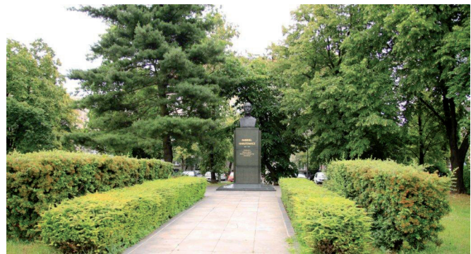
Ryc. 18. Popiersie prezydenta Gabriela Narutowicza

Wyróżniającą się formą zagospodarowania placu jest drzewostan. Występuje on zarówno w części centralnej – na obszarze pętli tramwajowej, jak i w części południowo-wschodniej – wzdłuż ul. Akademickiej. Wykonana w 2012 roku inwentaryzacja dendrologiczna [Szczegółowa inwentaryzacja-