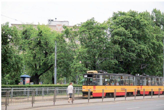
Ryc. 21. Zadrzewienia w centralnej części placu. W głębi – gmach „Akademika”