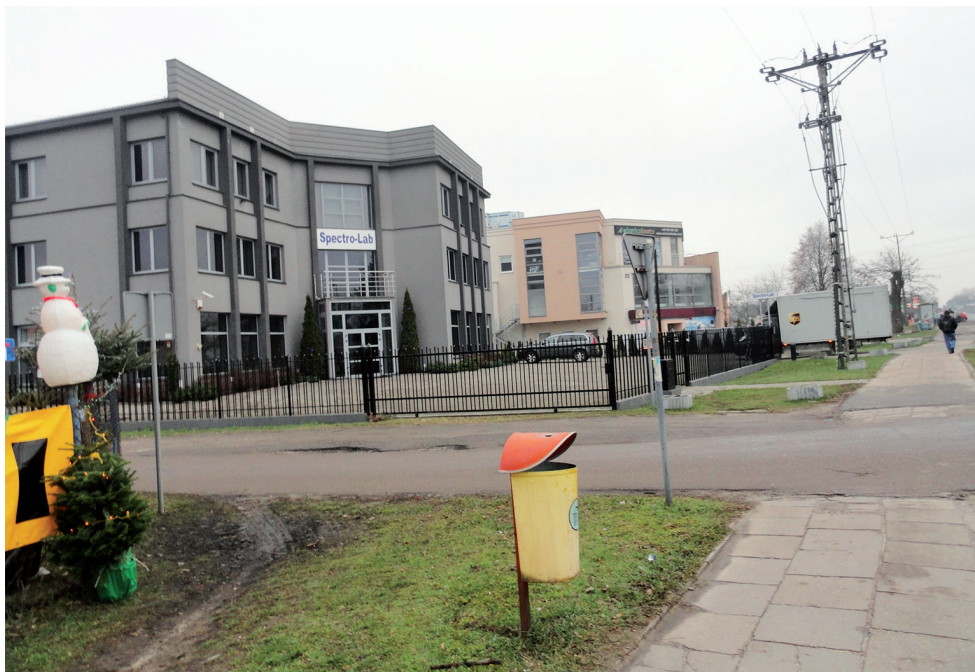
Ryc. 5. Zabudowa ul. Warszawskiej, głównej ulicy Łomianek