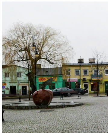
Ryc. 4. Centrum rynku z jabłkiem – symbolem współczesnego Tarczyna

Odzyskanie w 1993 r. statusu miasta zmieniło funkcję administracyjną Bieżunia. Miasto, jak i inne, które ten status odzyskały, jest siedzibą gminy miejsko-wiejskiej, głównie rolniczej (z hodowlą drobiu, szklarniami, drobnym przemysłem spożywczym). Rozwija się też funkcja kulturalna i edukacyjna. Pamięć o przeszłości utrwała – jedyne w Polsce – Muzeum Małego Miasta, Oddział Muzeum Wsi w Sierpcu, eksponującego kulturę materialną małego miasta z początku XIX w., a także odbywające się na terenie gminy uroczystości związane z upamiętnieniem Bohaterów Powstania Styczniowego na Północnym Mazowszu.