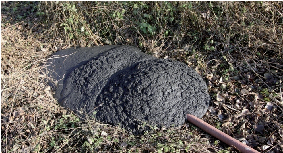
Ryc. 2. Wydobyty osad denny o konsystencji zaprawy betonowej

Opisana powyżej technologia wydobywania osadów dennych istotnie umożliwia uzyskanie wysokiej koncentracji składnika stałego pochodzenia mineralnego i organicznego, co