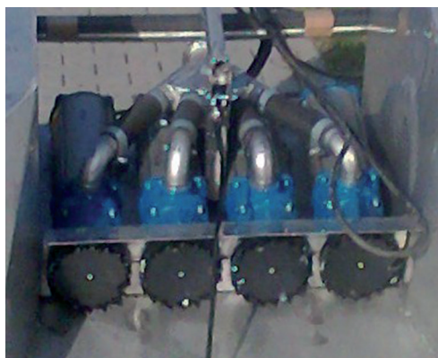
Ryc. 1. Zespół roboczy odmularki pobierający osady denne wyposażony w cztery pompy

Również w źródłach zapisu cyfrowego (internetowych) zamieszczono wiele