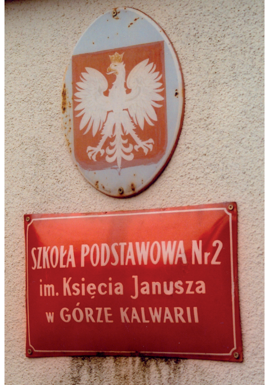
Ryc. 3. Tablica na budynku Szkoły Podstawowej nr 2 im. Księcia Janusza w Górze Kalwarii

Inny sposób upamiętniania jest związany z utworzonym w ostatnich latach Szlakiem Książąt Mazowieckich. Składa się on z 5 tras, z których jednej patronuje książę Janusz Starszy [http://www.jablonka.com.pl/szlak-ksiazat-mazowieckich]. Szlak jego imienia o długości ponad 300 km wiedzie na południe od Warszawy przez Czersk, Warkę, Kozienice, Sieciechów, Radom, Hżę, Szydłowiec, Przybyszew, Grójec, Tarczyn i przez Piaseczno wraca do Warszawy [„Na Szlaku Książąt Mazowieckich” 2012, s. 2]. Na szlaku są rozstawione ta-