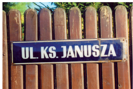
Ryc. 8. Tabliczka z nazwą ulicy Ks. Janusza w Ciechanowie