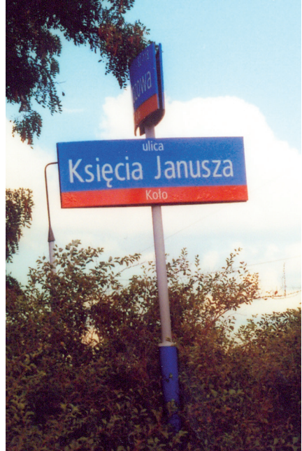
Ryc. 7. Tabliczka z nazwą ulicy Księcia Janusza w Warszawie na Woli

Trzech respondentów dowiedziało się o tym władcy z książek lub broszur, dotyczących dziejów miasta i okolic, w których sami mieszkali. Jeden z nich, to mężczyzna z Grójca w wieku ok. 50-60 lat, będący geodetą. Z książek dotyczących historii Grójca pamiętał, że Janusz Starszy nadał temu ośrodkowi prawa miejskie. Dwaj pozostali respondenci, to mężczyźni mieszkający w Górze Kalwarii. Obaj byli z wyglądu w podobnym wieku ok. 60-70 lat. Jeden z nich,