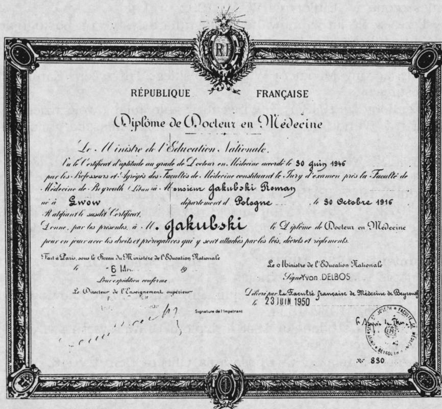
Dyplom Uniwersytetu w Bejrucie 1950