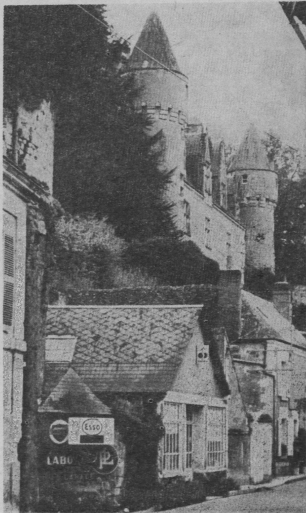
1. Zamek w Montrésor 1. Le Château à Montrésor

jektowanego dla katedry w Le Puy pomnika Jana Sobieskiego, wyroby złotnicze i fragmenty zastaw stołowych po Jagiellonach i Wazach, pamiątki po Powstaniu Styczniowym, bogata galeria obrazów mistrzów włoskich i holenderskich z XV—XVII w., portrety rodziny Branickich i spowinowaconych z ni-