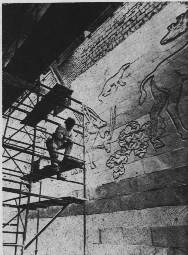
2. Rzeźbiarka na tle ściany, której płaszczyznę zakomponowuje reliefem.

Ekspozycja nowego Muzeum Paleontologicznego udostępniana będzie stopniowo w miarę wykańczania poszczególnych jej odcinków,