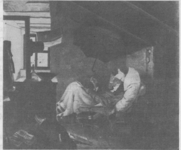
4. Carl Spitzweg, Biedny poeta , 1839 r.

Malarstwo niemieckie połowy XIX w. reprezentuje Spitzweg obrazem Biedny poeta z 1839 r. i Adolf von Menzel — Pokój z siostrą z 1847 r.