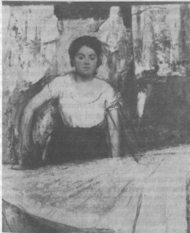
5. Edgar Degas, Prasowaczka , ok. 1869 r.

Spośród wystawionych tu obrazów na szczególną uwagę zasługuje Maneta Śniadanie w atelier z 1868/69 r., Moneta Most na Sekwanie koło Argenteuil z 1874 r., Edgara Degasa Prasowaczka , z ok. 1869 r.