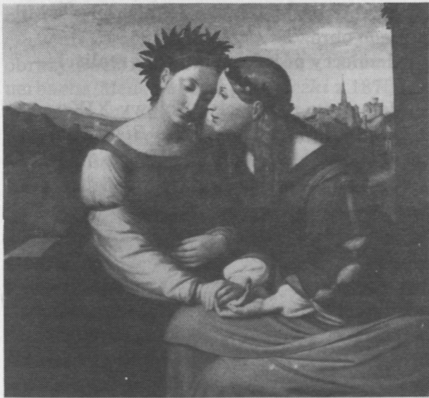
2. Friedrich Overbeck, Italia i Germania , 1828 r. 2. Friedrich Overbeck, Italie et Germanie .

um zwiedziło 500 000 osób, a po 4 latach zwiedzających było 6 000 000; zakupili oni przy tym ponad 600 000 katalogów i innych wydawnictw muzealnych i artystycznych.