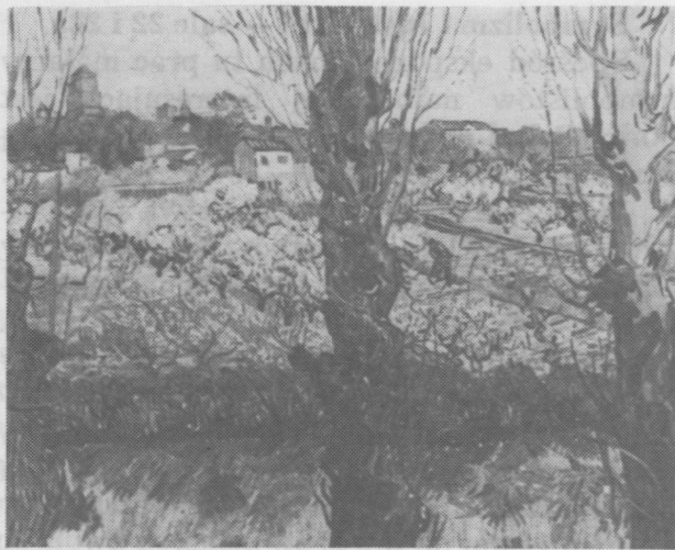
6. Vincent van Gogh, Widok na Arles , 1889 r.

Do znaczniejszych dzieł artystów należą wystawiony w tej sali Cézanne'a Tunel kolejowy