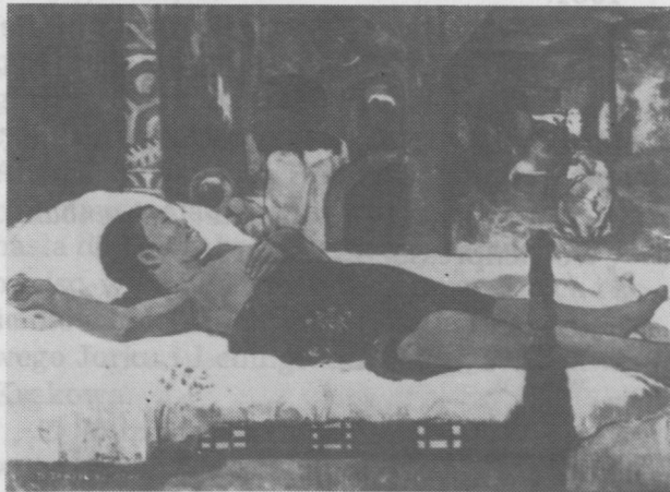
7. Paul Gauguin, Naissance de Christ , 1896.

wy z 1870 r., van Gogha Widok na Arles z 1889 r. i Gauguina Narodziny Chrystusa z 1896 r.