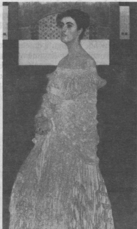
8. Gustav Klimt, Portret Margarety Stonborough-Wittgenstein , 1905 r.

les romantiques français tardifs et les réalistes; Kaulbach — ses projets et ses esquisses; la peinture historique et sociale; la peinture de la période du „Gründerzeit”; Hans von Marées, Böcklin, Feuerbach, Thoma; Leibl et ses disciples; les impressionnistes français; Cézanne, van Gogh et Gauguin; le réalisme social, les impressionnistes allemands; les secessionnistes; le symbolisme et le jugendstil. Au rez-de-chaussée de la Nouvelle Pinacothèque se trouve le Centre Pédagogique du Musée qui organise des activités didactiques et audiovisuelles, ainsi que des expositions temporaires, puis la galerie expérimentale pour jeunes talents. Au sous-sol se trouvent un restaurant et un café 120 personnes, ouvert de 9 heures du matin jusqu'à minuit (il y a, de plus, 100 places sur les terrasses et dans le jardin avec vue sur le lac artificiel, pour ceux qui visitent le musée en été).