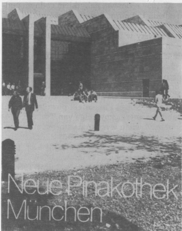
1. Nowa Pinakoteka, widok ogólny.