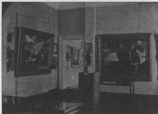
1. Bydgoszcz, fragment Miejskiej Galerii Obrazów i Rzeźb (1927).

Powstałe muzeum było własnością Gminy Miasta Bydgoszczy i stanowiło odrębną jednostkę budżetową. Władzę zwierzchnią sprawował prezydent miasta poprzez odpowiednie komórki administracyjne.