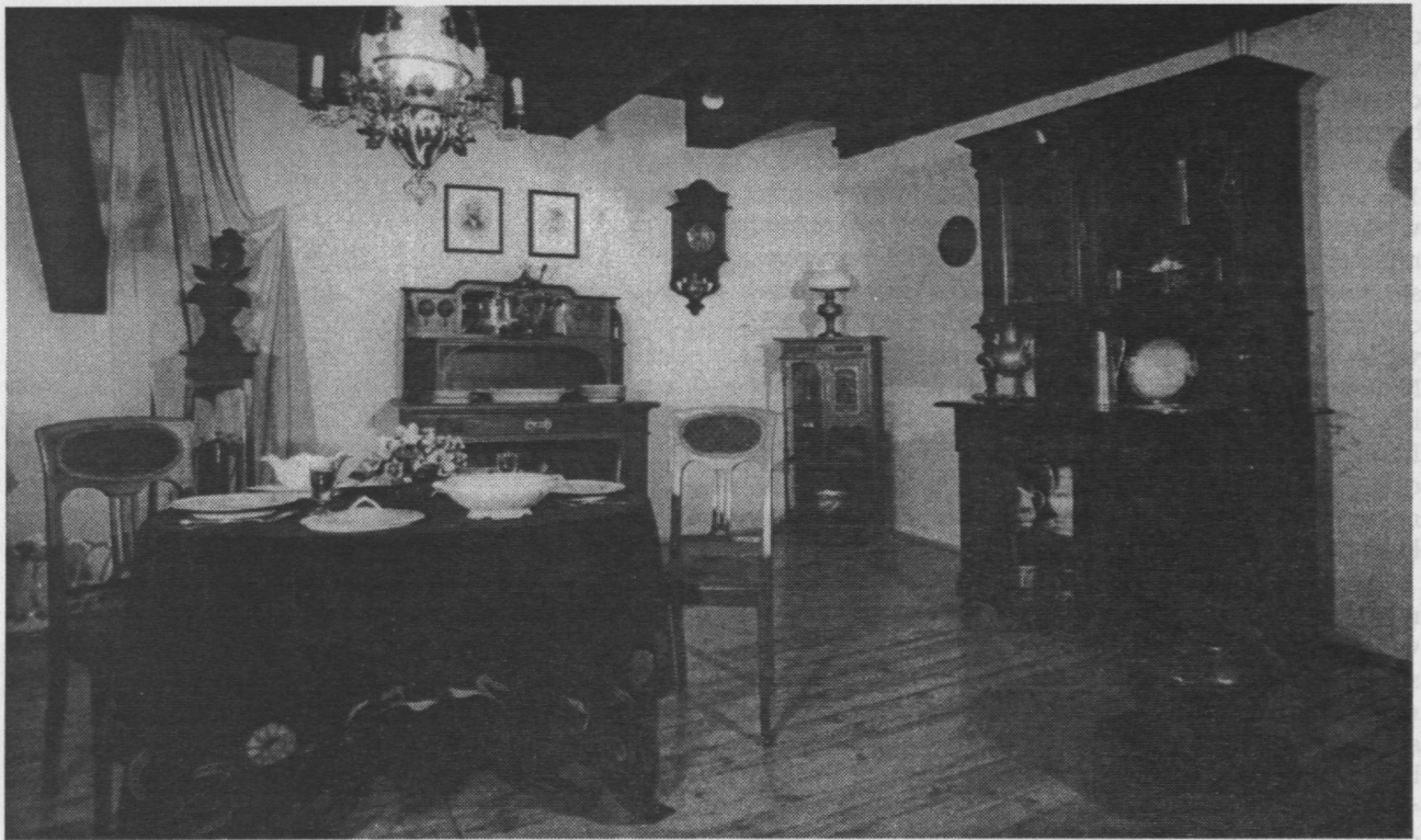
4. Muzeum okręgowe w Bydgoszczy, fragment ekspozycji w „Białym Spichrze”, kąciak secesyjny (1993).