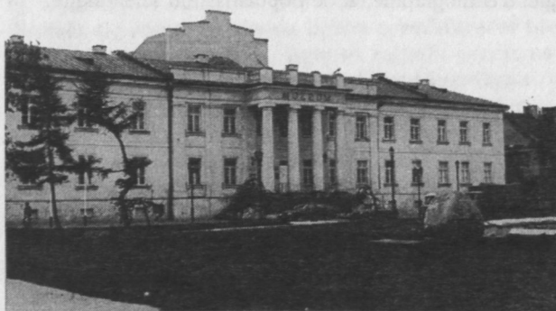
1. Radom, siedziba Muzeum Okręgowego. 1. Radom, le Musée Régional.

Zgodnie z nowym statutem, miało to być muzeum wielodziałowe. Swoją działalnością objęło województwo radomskie, a w zakresie badań i gromadzenia zbiorów etnograficznych i przyrodniczych również tereny sąsiednich województw. Zwierzchni