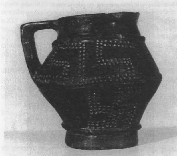
2. Boży Dar — dzban kultowy z okresu wpływów rzymskich.

Zabytki wczesnośredniowieczne w dużym stopniu to efekt prac ekspedycji wykopaliskowej IHKM PAN kierowanej przez E. Kierzkowską-Kalinowską i przekazane nam w 1974 r. Pochodzą one z grodziska „Piotrówka”, z terenu osad wczesnośredniowiecznych zlokalizowanych w dolinie rzeki Mlecznej oraz ze wzgórze, na którym powstało Stare Miasto. Są to bogate materiały dotyczące osadnictwa od VII do XIV w. Dział archeologiczny prowadził badania w wielu punktach miasta. Najcenniejsze znaleziska uzyskano na st. 4 — osada i cmentarzysko wczesnośredniowieczne przy ul. Li-