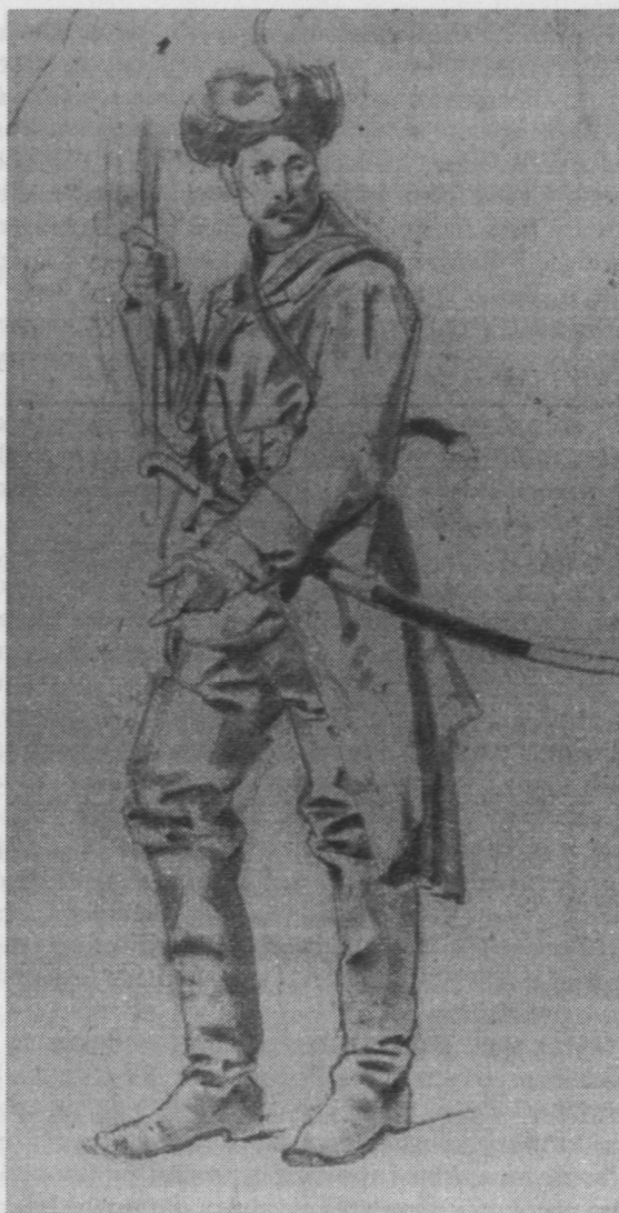
6. Józef Brandt, Karta ze szkicownika , ok. 1880, karton, ol., 18,3 x 10 cm.

Kolekcja rzemiosła artystycznego obejmuje 276 pozycji — składają się nań meble zabytkowe w stylu