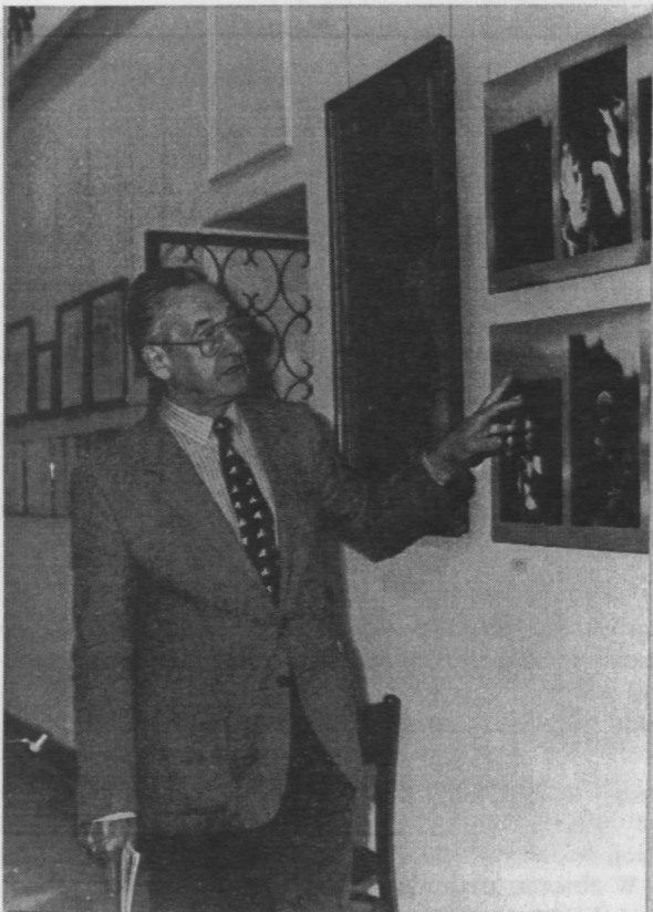
8. „Andrzej Wajda — Autoportret” - wystawa nagrodzona w 1990 roku.