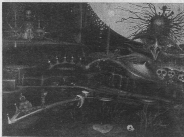
7. Władysław Wałęga, Akwedukty I , płótno, ol., 56 x 43 cm.