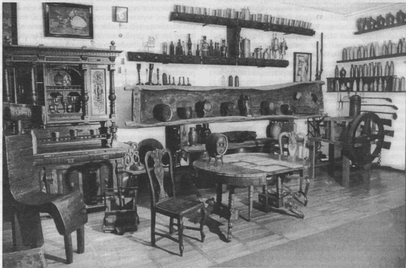
1. Muzeum Okręgowe w Zielonej Górze, wystawa poświęcona winiarstwu.

Posiadane i powiększające się z czasem zbiory, o różnej wartości zabytkowej, podzielone zostały w latach 1923-1925 na poszczególne sale, a w zasadzie kąciki tematyczne prezentowane w formie stałych ekspozycji. Po wielokrotnych zmianach ekspozycji.