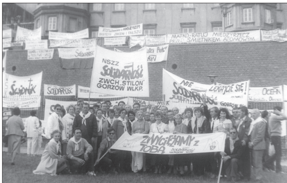
II Pielgrzymka DŚP (wrzesień 1987)