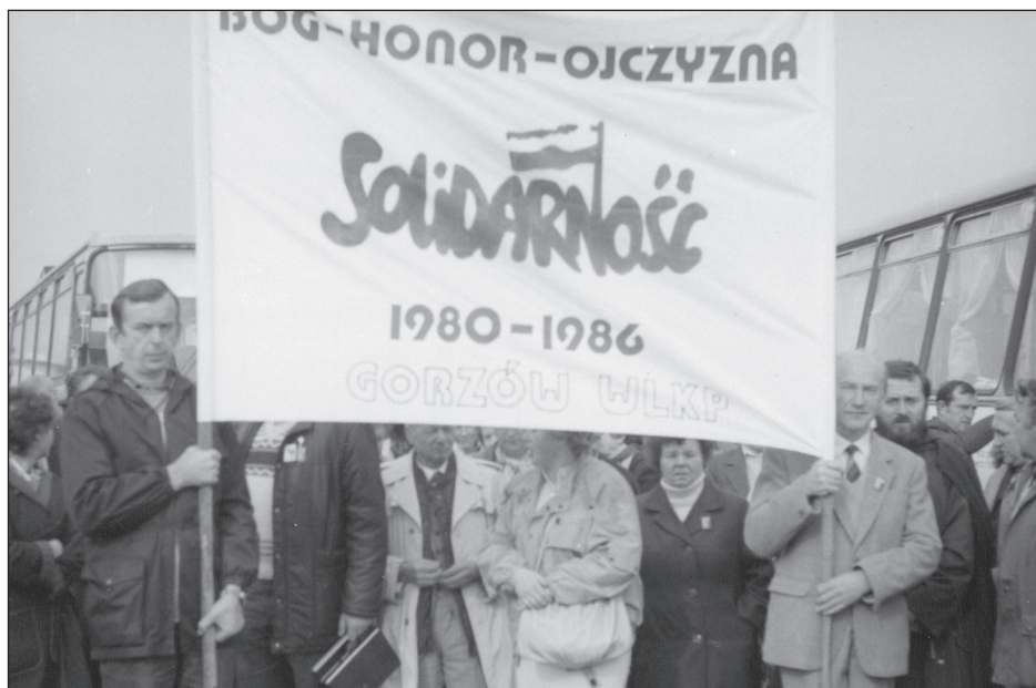
I Pielgrzymka DŚP (wrzesień 1986)