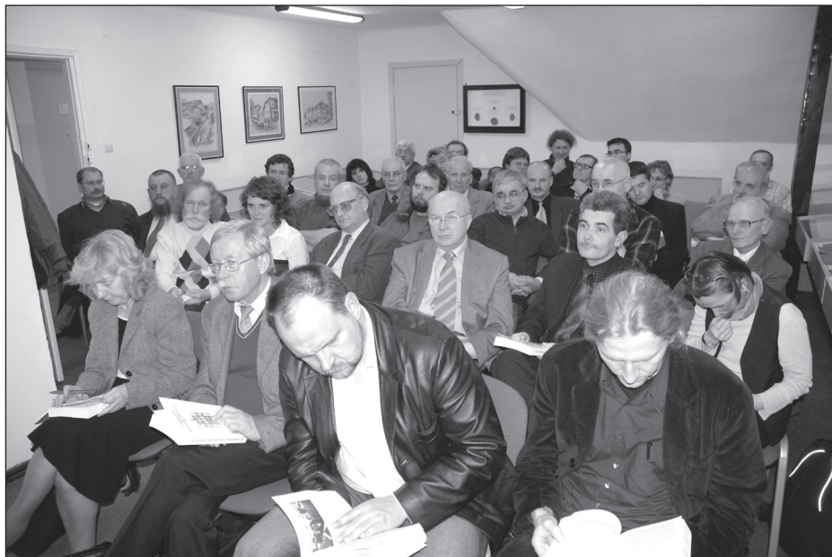
Promocja NRHA nr 15

7 W Zamiejscowym Wydziale Kultury Fizycznej odbyła się konferencja zorganizowana przez gorzowski oddział Polskiego Towarzystwa Historycznego pt. „Śladami pamięci – obecność Żydów w dziejach Gorzowa. W 70. rocznicę Nocy Kryształowej.