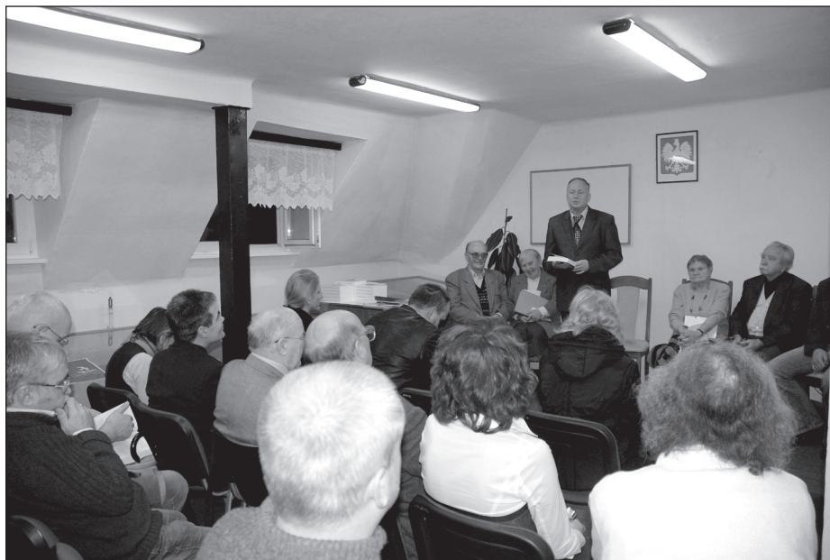
Promocja NRHA nr 15

6 W Archiwum Państwowym odbyła się promocja 15 tomu „Nadwarciańskiego Rocznika Historyczno-Archiwalnego”.