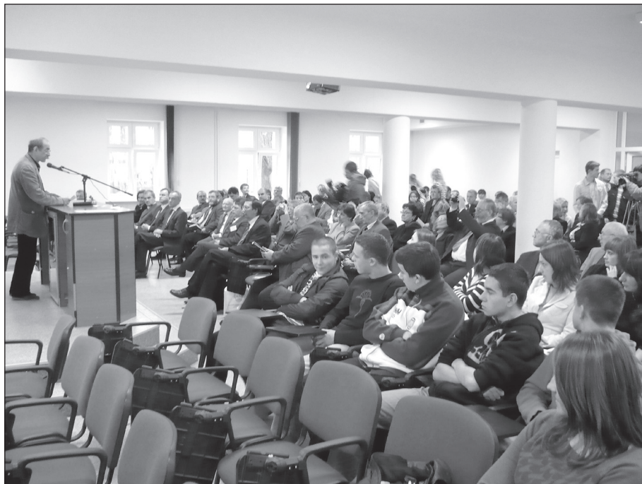
Konferencja „Oaza wolności”