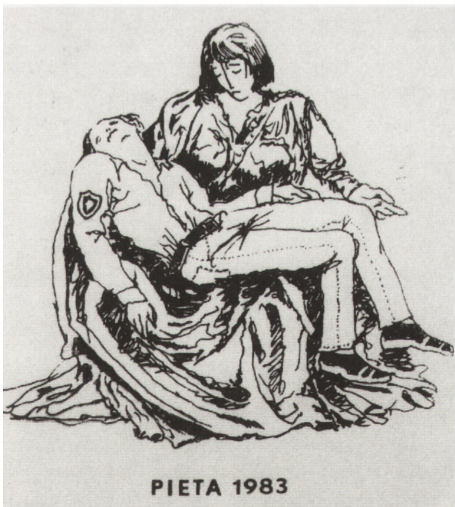
Pieta 1983 r.