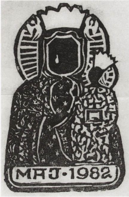
Hanna Huskowska-Młynarska: Matka Boska Częstochowska z łezką, 1982 r.