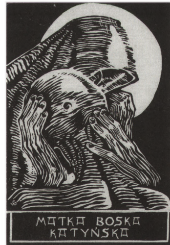
Matka Boska Katyńska, 1982 lub 1983 r.