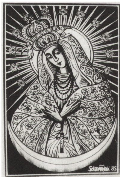
Matka Boska Ostrobramska, obrazek wydany przez NSZZ "Solidarność" 12 X 1985 r.