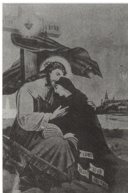
"Polska w kajdanach", 1891 r.