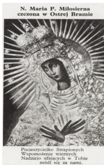
Obrazek z Matką Boską Częstochowską wydany przez Kurię Polową PSZ na Zachodzie, Londyn 15 sierpnia 1941 r.