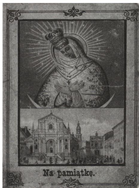
Obrazek pątniczy z wizerunkiem Matki Boskiej Ostrobramskiej kolportowany w Królestwie Polskim, koniec XIX w.