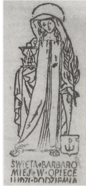
Reprodukcja obrazka konspiracyjnego z litanią do św. Barbary, 1982 r.