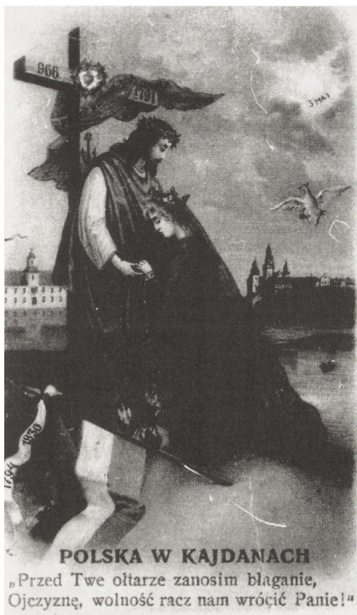
"Polska w kajdanach", 1907 r.