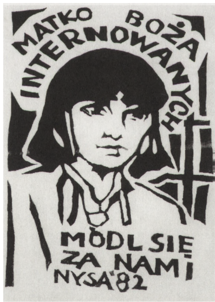
Matka Boża Internowanych, Nysa, 1982 r.