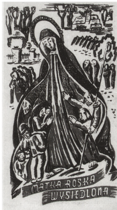
Matka Boska Wysiedlona, 1944 r.