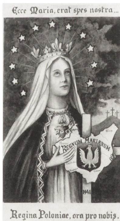
Obrazek konspiracyjny z 1941 r.