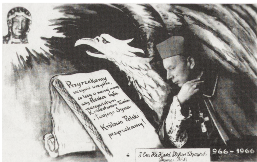
Obrazek drukowany techniką fotograficzną na obchody Millenium, 1966