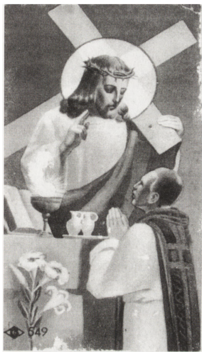
Obrazek z drukowaną konspiracyjnie litanią na odwrocie.