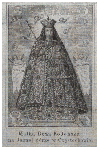
Obrazek z Matką Boską Kodeńską.