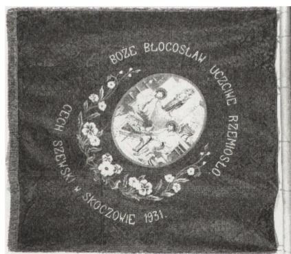
Rewers sztandaru Cechu Szewców. Skoczów 1931. MRy (R-H) 1089