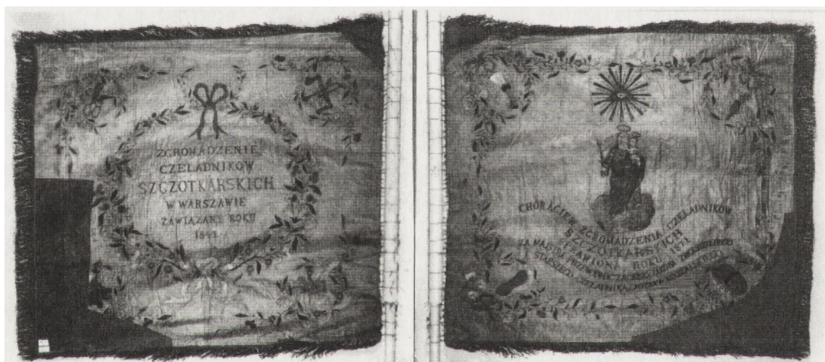
Awers i rewers Sztandaru Zgromadzenia Czeladników Szczotkarskich. Warszawa 1843. MRy (R-H) 1036