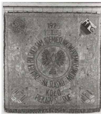
Awers i rewers sztandaru Związku Polskich Samodzielnych Rzemieślników i Przemysłowców na Śląsku. Piekary Śląskie 1938. MRy (R-H) 1673