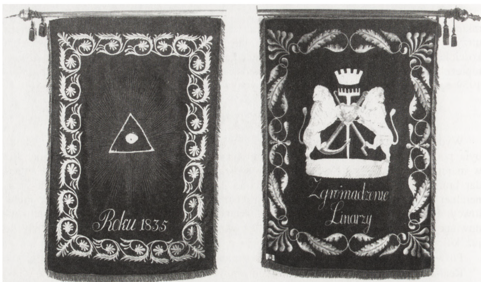
Awers i rewers sztandaru Cechu Liniarzy. Warszawa 1835. MRy (R-H) 1034/1-2