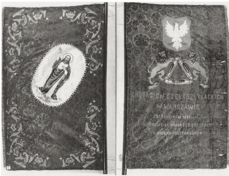
Awers i rewers sztandaru czeladników tkackich. Warszawa 1898. MRy (R-H) 1069/1-2