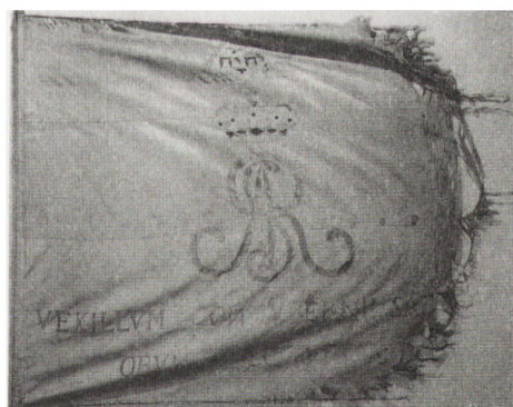
Awers sztandaru Cechu Mydlarzy. Warszawa, koniec XVIII w. MRy (R-H) 1077/1-2