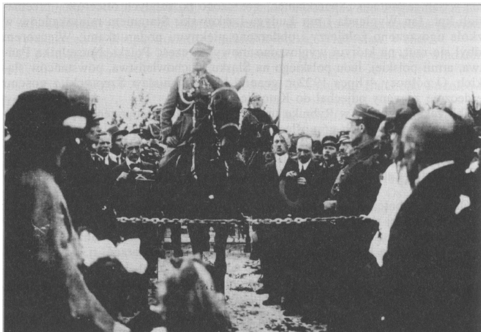
Powitanie Wojska Polskiego na moście szopienickim 20 czerwca 1922 roku. Na fotografii widoczny żelazny łańcuch symbolizujący niewolę. Na koniu gen. broni Stanisław Szeptycki.