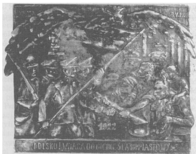
Emblemat Górnego Śląska powracającego do Polski, 1922 r.