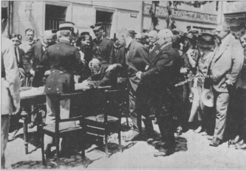
Rybnik - Rynek, 3 lipca 1922 r., podpisanie protokołów przejęcia miasta Rybnika i powiatu przez władze polskie i aktu formalnie kończącego przejmowanie przyznanej Polsce części Górnego Śląska.