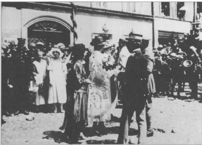
3 lipca 1922 r., delegacja rybnickich kobiet wręcza kwiaty przedstawicielom Międzysojuszniczej Komisji Plebiscytowej i Rządzącej.