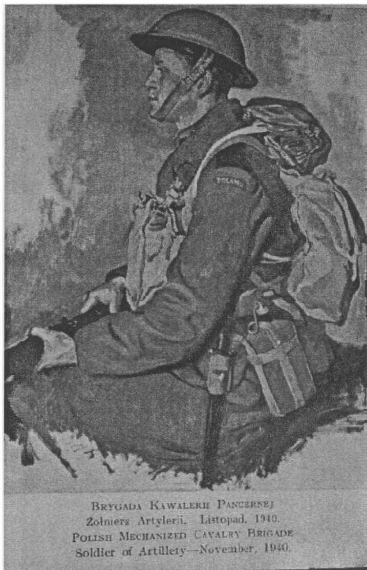
"Brygada Kawalerii Pancernej Żołnierz Artylerii. Listopad 1940 r. Polish Mechanized Cavalry Brigade Soldier of Artillery - November, 1940". Pocztówka ze zbiorów Muzeum Miejskiego w Zabrzu.