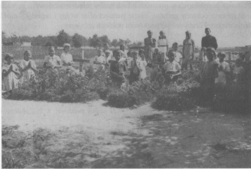
Cmentarz w Pruszkowie. Groby żołnierzy polskich, 1939