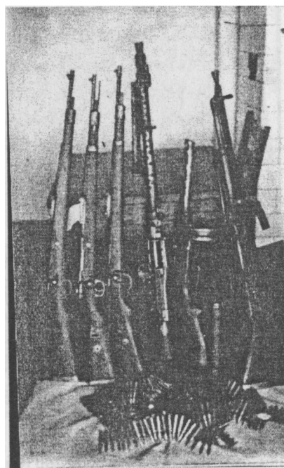
Fot. 3. Mat. śledcze dotyczące oddziału AK „Błyskawica”. Broń leśnego plutonu AK „Błyskawica”.