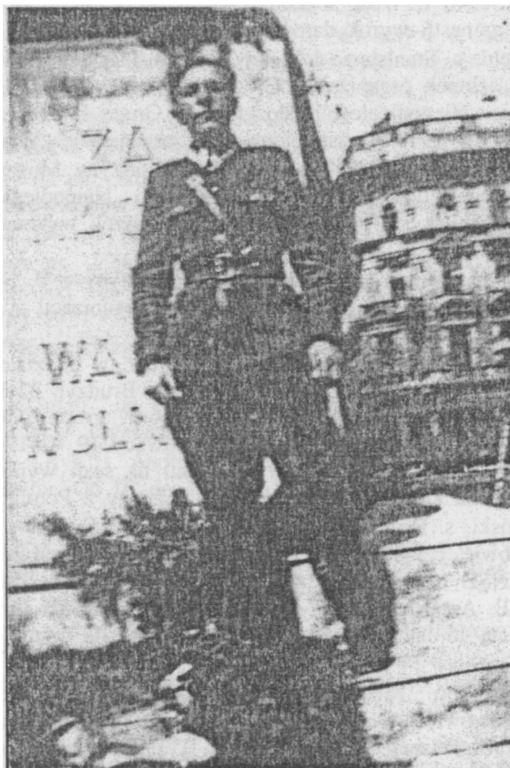
Fot. 1. Kpt. Eugeniusz Kokolski ps. „Groźny”.

Jerzy Żebrowski ps. „Konarski”, ur. 27 III 1927 r. w Łodzi 36 .