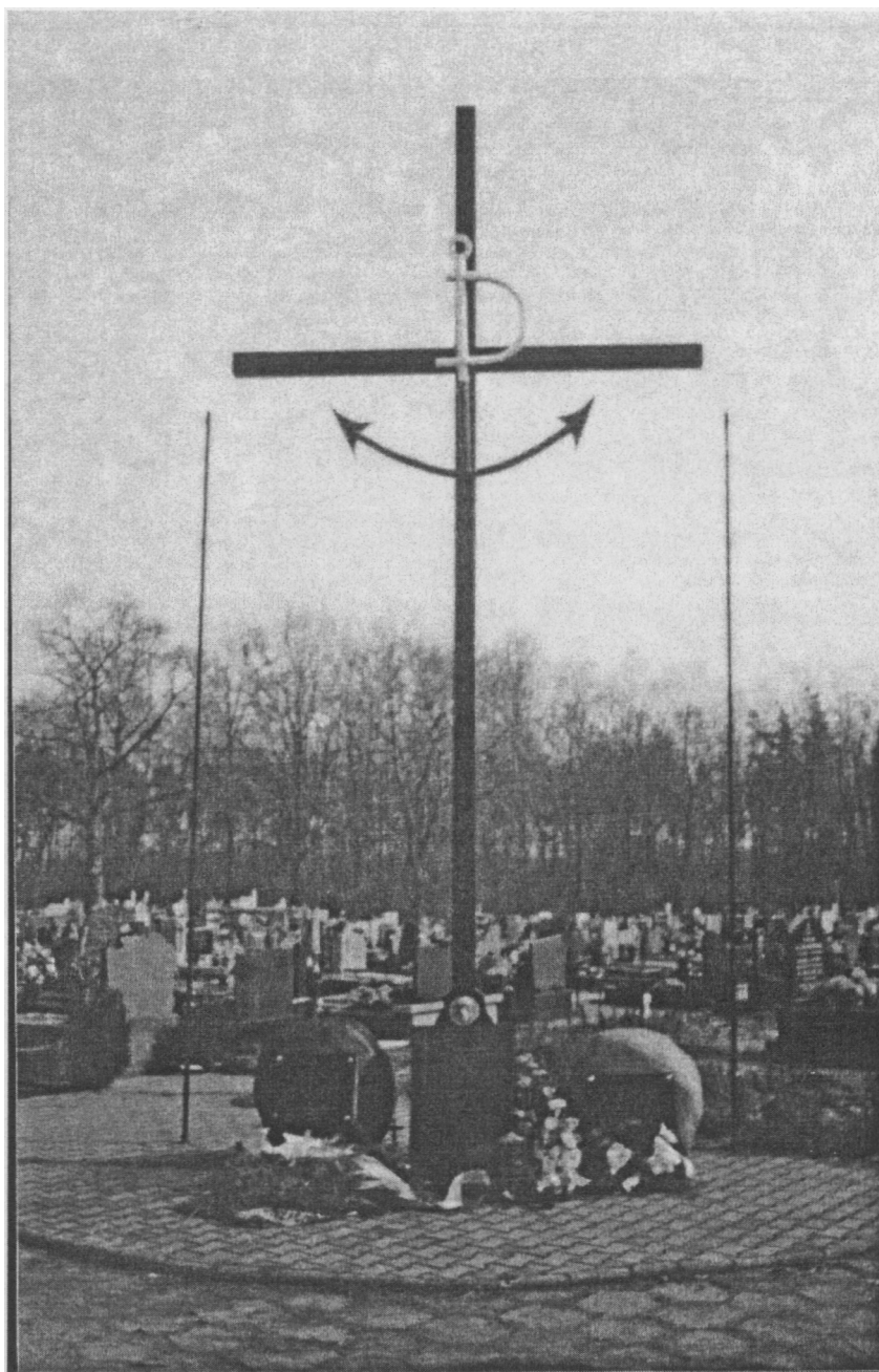
Fot. 6. Epitafium poświęcone żołnierzom II Konspiracji ze zgrupowania „Niepodległość”, plutonu leśnego AK „Błyskawica” pod dowództwem por. Józefa Kubiaka „Pawła”. Ozorków 2003 r.