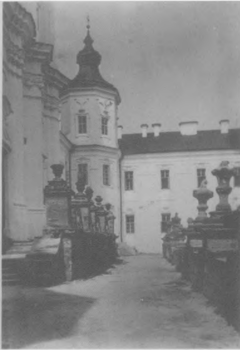
Krzemieniec. Fragment Kościoła licealnego. Widok z wirydarza. ok. 1937 r.