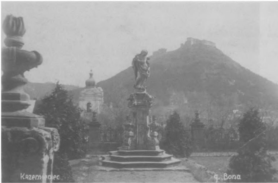
Krzemieniec. Barokowa figura Matki Boskiej w wirydarzu licealnym na tle Góry Bony, ok. 1937