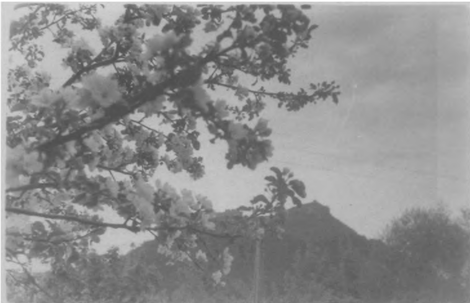
Krzemieniec. Góra Bony wiosną. ok. 1937