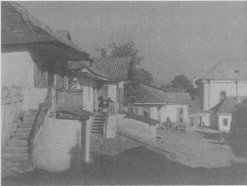
Krzemieniec. Domy na tyłach synagogi.