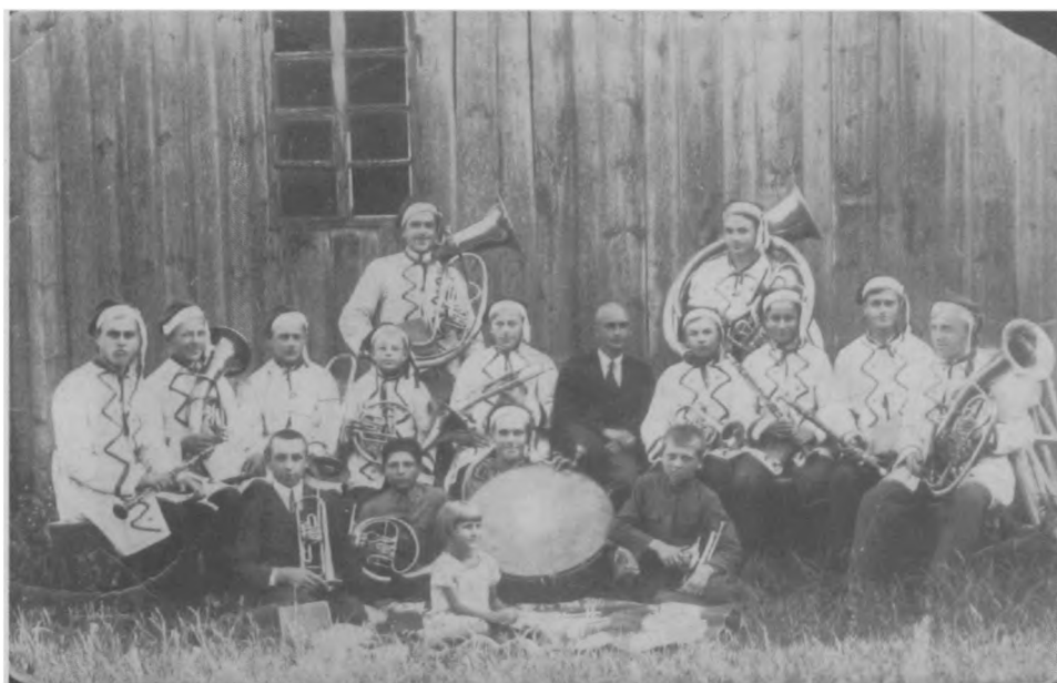
Ludwipol. Orkiestra Antoniego Olejasza [1935]