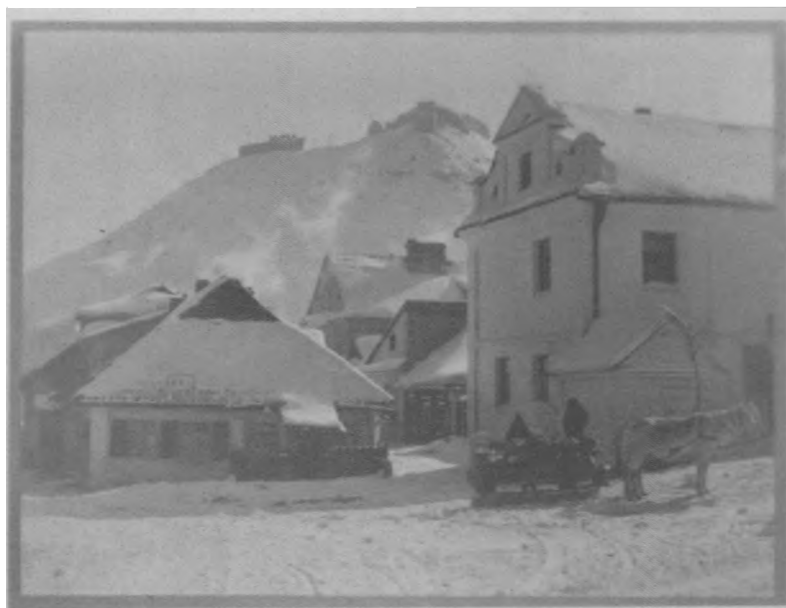
Krzemieniec. Widok Góry Bony z rogu ulic Pierackiego i Licealnej. Fot. H. Hermanowicz, ok. 1937

Fotografie ze zbiorów Muzeum Niepodległości