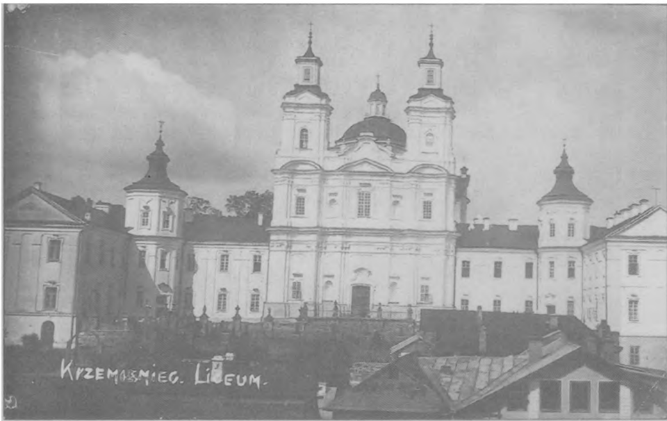
Krzemieniec. Kompleks licealny, ok. 1937