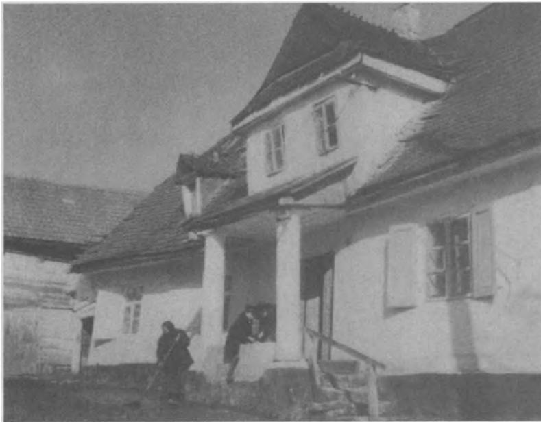
Krzemieniec. Dworek mieszczański, 1935-1938