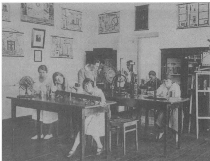
Krzemieniec. Gabinet fizyczny w Liceum Krzemienieckim, 1935-1938