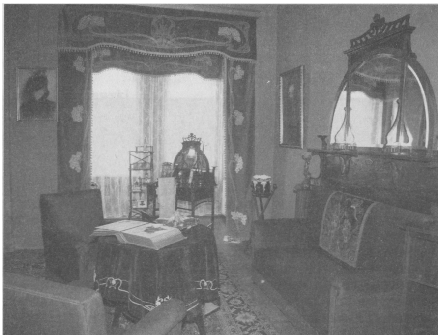
Secesyjne wnętrza – buduar i gabinet