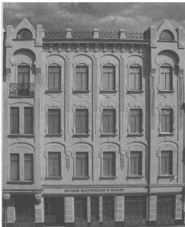
Siedziba Muzeum Mazowieckiego w Płocku w secesyjnej kamienicy (ul. Tumska 8)

Znakomitą większość problemów rozwiązałoby dobudowanie trzeciego pawilonu. Pozyskaliśmy pieniądze na zakup działki przylegającej do naszego terenu. Jednakże skomplikowana sytuacja własnościowa nie pozwala na szybką realizację planów. Jednak systematycznie rozwiązujemy pojawiające się problemy i myślę, że za trzy lata rozpoczniemy budowę trzeciego pawilonu. W perspektywie rozwoju muzeum trzeba wziąć pod uwagę poszerzenie naszej przestrzeni o działkę Nr 798, co umożliwiłoby dojazd od ulicy Kościuszki, posiadanie własnego podwórka oraz dalszej przestrzeni ekspozycyjnej.