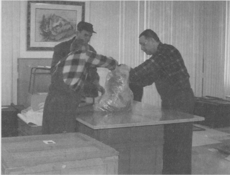
Przeprowadzka do nowej siedziby Muzeum Mazowieckiego w Płocku