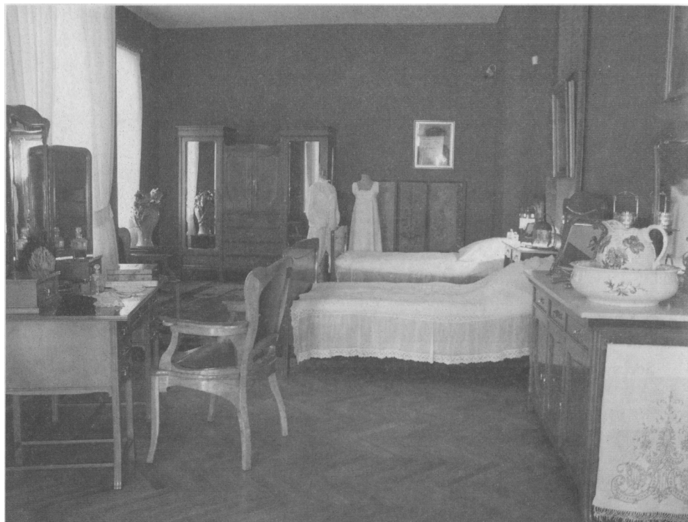
Sypialnia – fragment jedynej w swoim rodzaju ekspozycji secesyjnych wnętrz