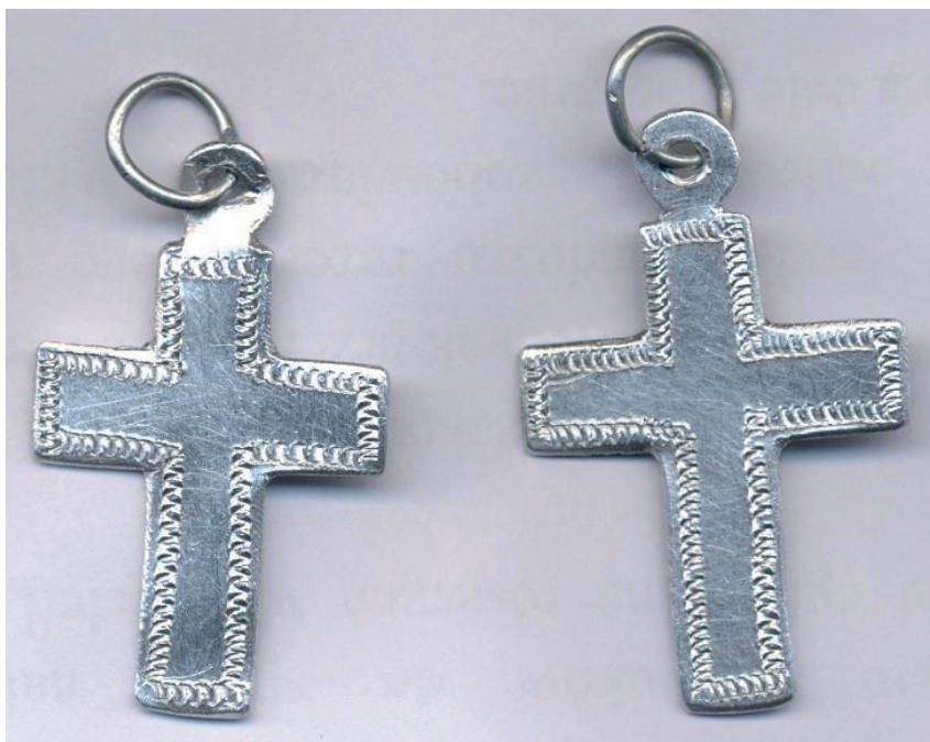
Fot.2. Efekt eksperymentu odtwórczego w postaci krzyżyków nawiązujących formą i ornamentyką do egzemplarzy zachowanych w zbiorach Muzeum. (Paweł Bezak)